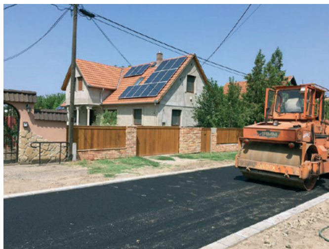
Folynak az út felújítási munkálatok a Nefelejcs utcában