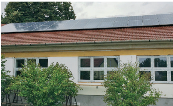
Energetikai fejlesztési munkálatok az Arany János Általános Iskolánál