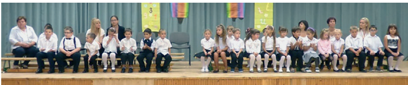
Az Arany János Általános Iskola első osztályos tanulóinak köszöntése az évnyitó ünnepségen

Felelős kiadó: Szentmártonkátai Nagyközség Önkormányzata, Felelős szerkesztő: a Szerkesztőbizottság Engedélyszám: 571/1991. Nyomtatott ISSN 2064-7689, Online ISSN 2064-7697, Megjelenik: 1650 példányban Nyomdai munkák: Tápió Nyomda Kft. +36 20/982-1180, +36 30/397-3559