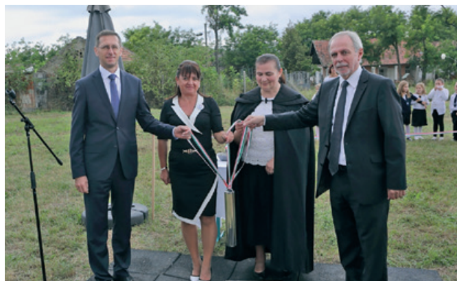
A Szentmártonkátai Református Egyházközség tornatermének az alapkö letétele