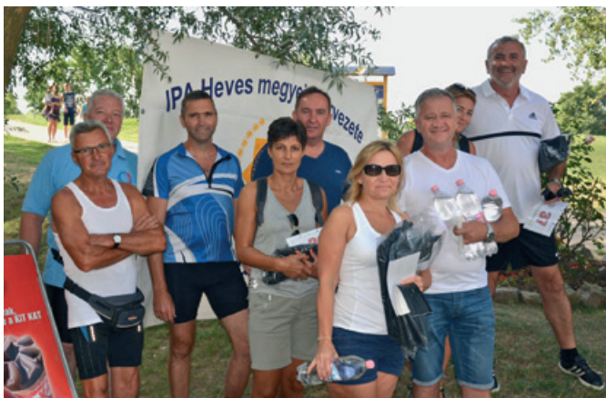
XXI. Tisza-tavi kerékpáros verseny résztvevői