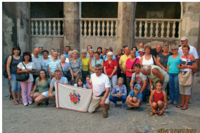
A nyugdíjas Klub nyári kirándulása