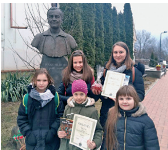
Székely József Református Általános Iskola, országos szavalóverseny résztvevői