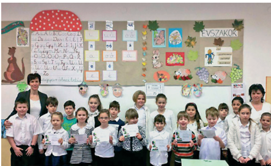
A Szentmártonkátai Arany János Általános Iskola nyelvész verseny résztvevői