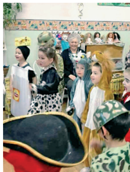
Farsangi mulatság az Aprajafalva Óvodában