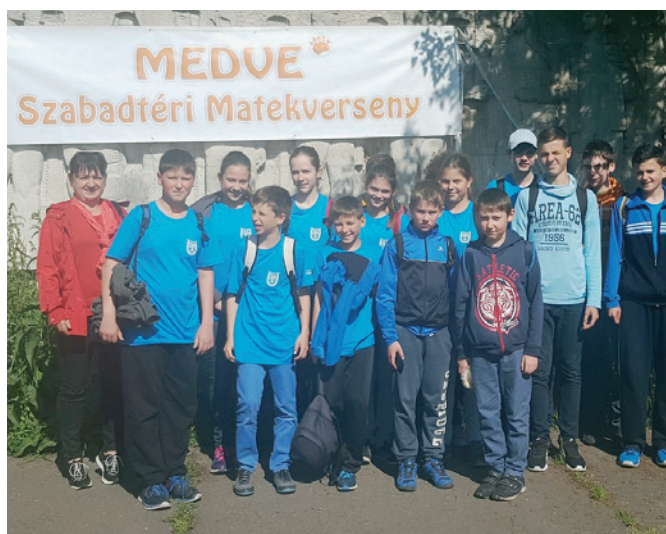
Székely József Református Általános Iskola Medve Szabadtéri Matekversenyen résztvevő tanulói