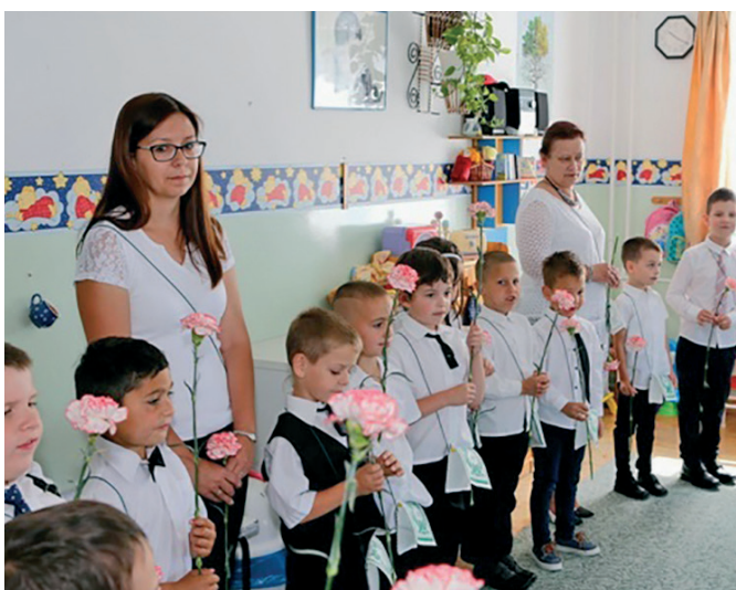
Ballagás az Aprajafalva Óvodában