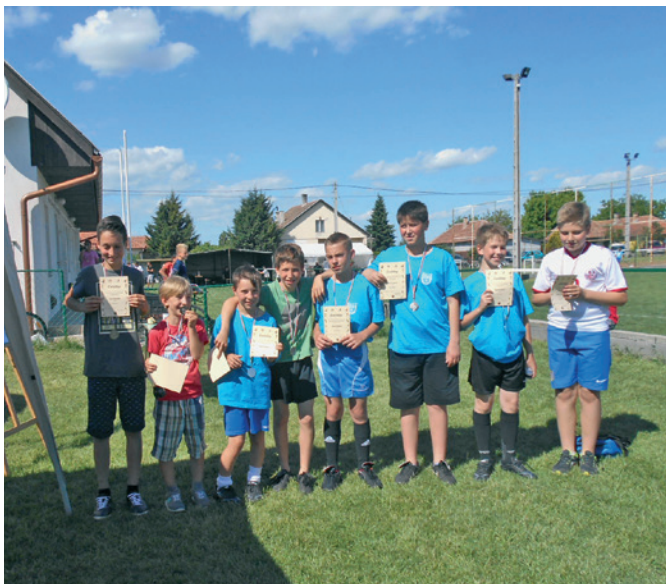
Szentmártonkátai sportnapja: kispályás foci díjátadó