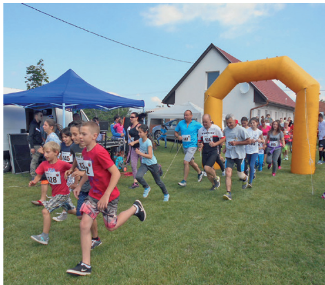
Szentmártonkátai sportnapja: az 5 km-es futóverseny rajtja