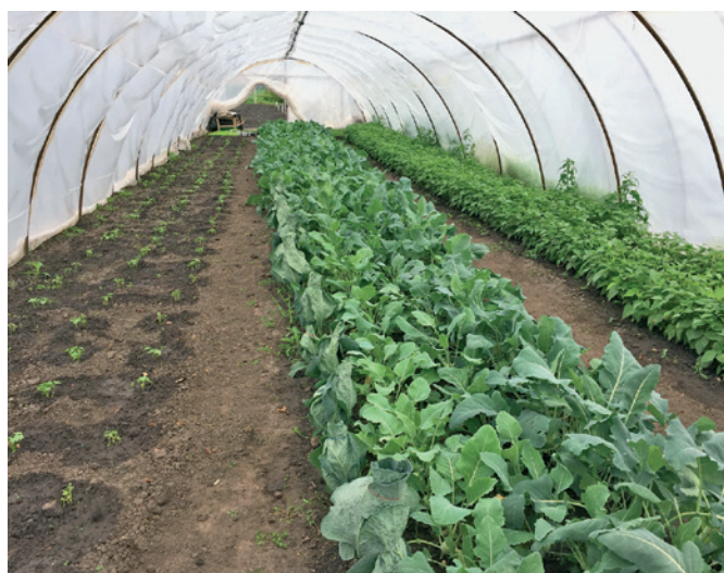
Start mintaprogram fóliasátra