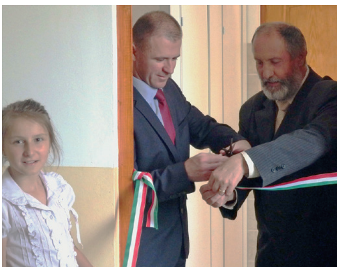
Szentmártonkátai Arany János Ált. Isk. újtelepi épületében kialakított mosdó átadása