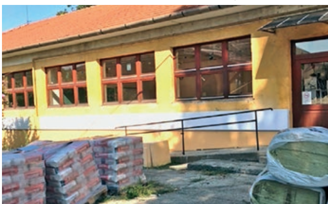
Bacsó Béla úti iskola szigetelése