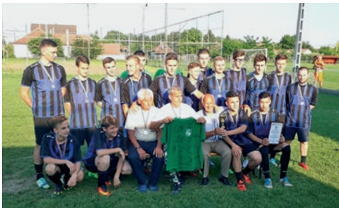
Szentmártonkátai U19-es csapata