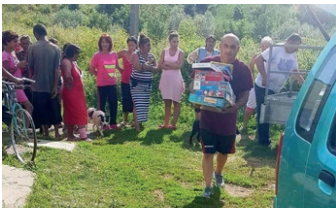
A szentmártonkátai Roma kisebbség és a tápióbicskei Roma kisebbség közös adománya az ország legszegényebb falujában élő gyermekeknek