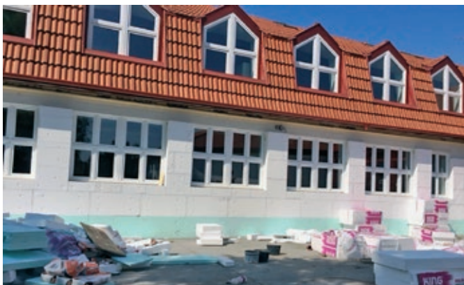
Arany János Általános Iskola szigetelése