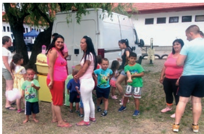
Hagyományörző Roma napi mulatság. Köszönjük a Polgárőrség egész napos közreműködését.