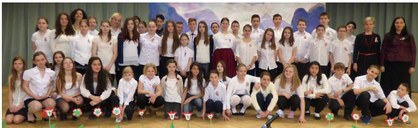
Március 15. ünnepség a Szentmártonkátai Arany János Általános Iskolában