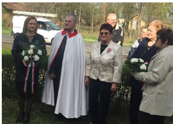
Koszorúzás Battha Sámuel szobránál