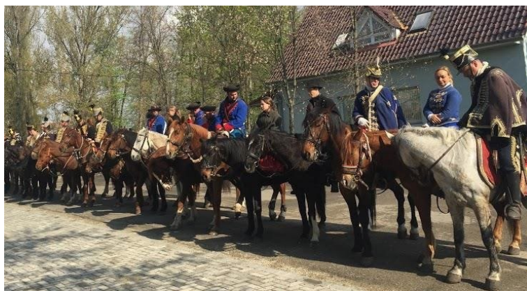
2017. évi Tavaszi Emlékhadjárat lovas huszárai