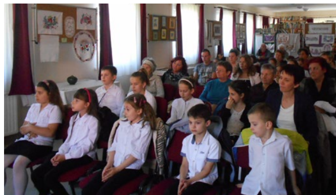
A Szabó Magda Nagyközségi Könyvtár és Teleház költészet napi műsora

Felelős kiadó: Szentmártonkátai Nagyközség Önkormányzata, Felelős szerkesztő: a Szerkesztőbizottság Engedélyszám: 571/1991. Nyomtatott ISSN 2064-7689, Online ISSN 2064-7697, Megjelenik: 1650 példányban Nyomdai munkák: Tápió Nyomda Kft. +36 20/982-1180, +36 30/397-3559