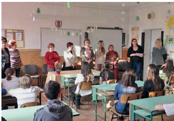
A Kazincy-verseny eredményhirdetésén a Szentmártonkátai Arany János Általános Iskolában