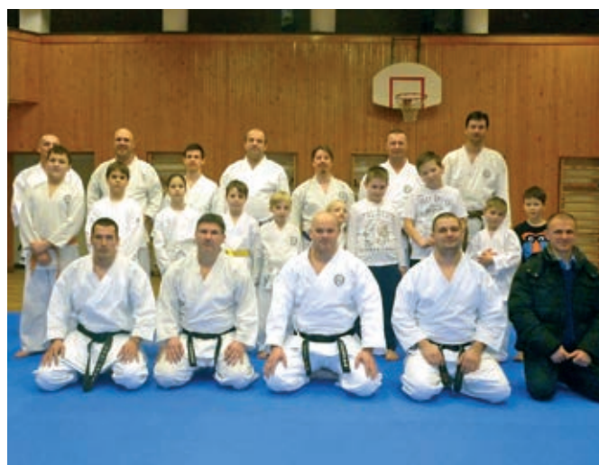
A helyi karate klub tagjai birtokba vették az új tatami-sportszőnyeget