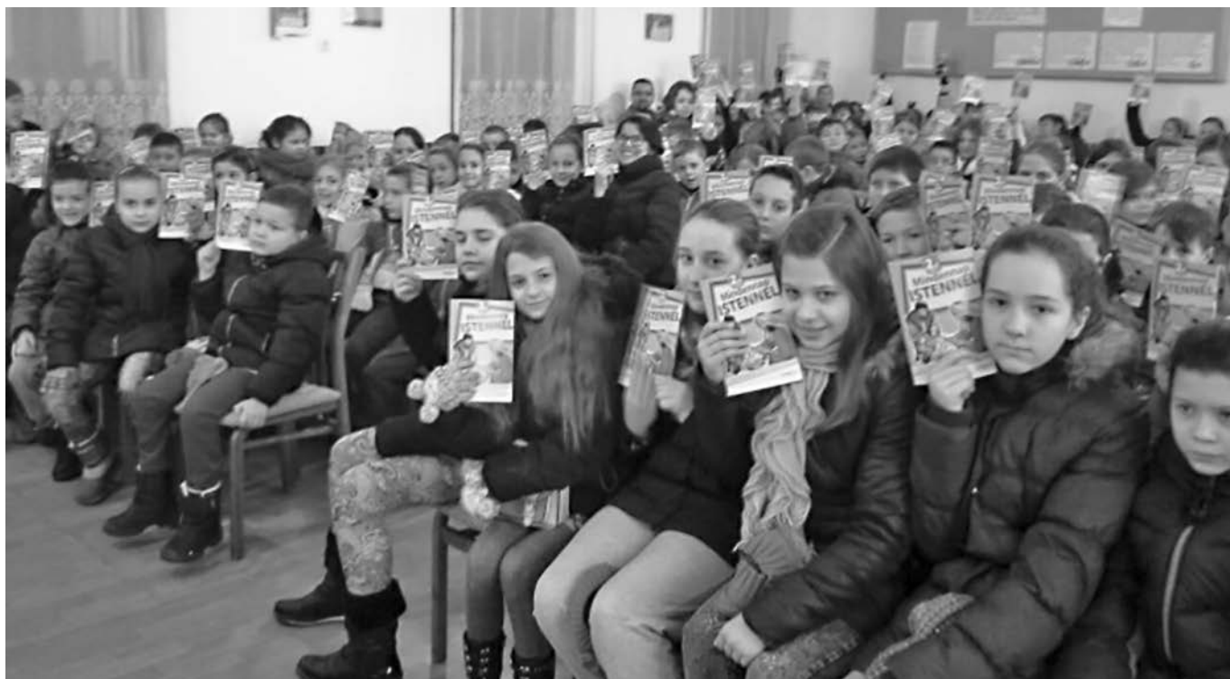
A Székely József Református Általános Iskola tanulói hittanos foglalkoztató könyvecskét kaptak ajándékba.