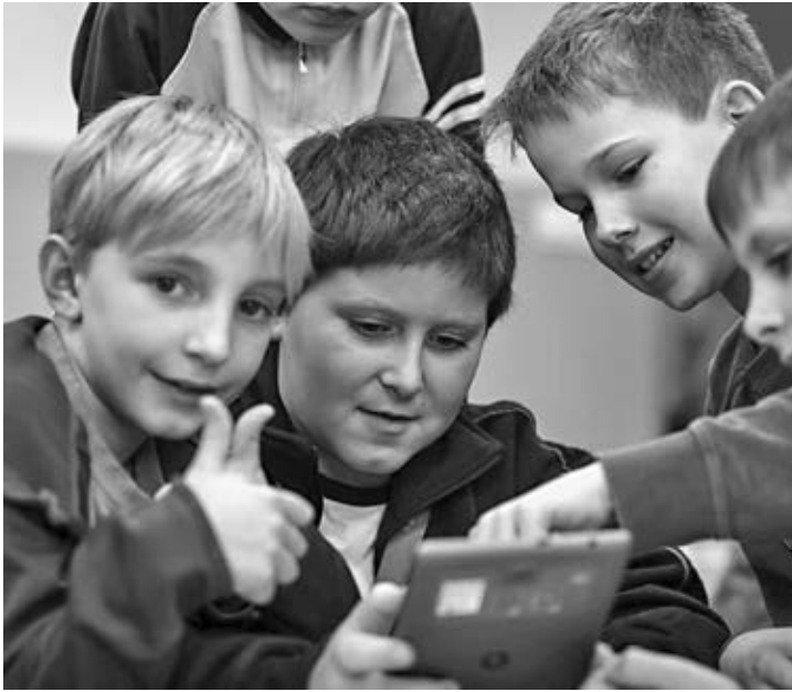
Táblagépek átadása a Székely József Református Általános Iskolában

is vannak iskolánkban, ahol a diákok elmondhatják azokat a lelki dolgokat, amelyek őket foglalkoztatják.