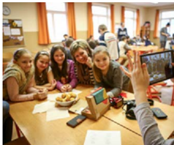
Táblagépek átadása a Székely József Református Általános Iskolában