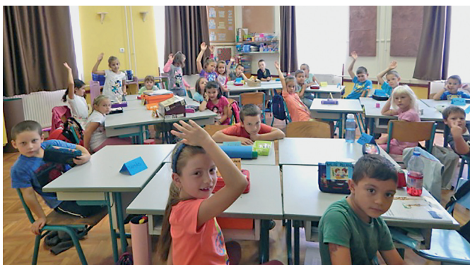
Székely József Ref. Ált. Iskolában kezdődhet a tanév