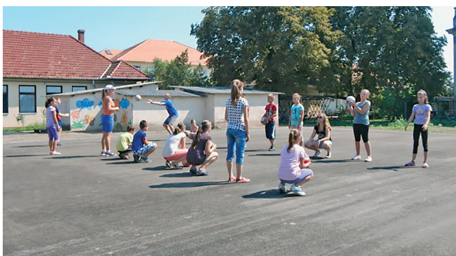
Református gyermeknapok – sport