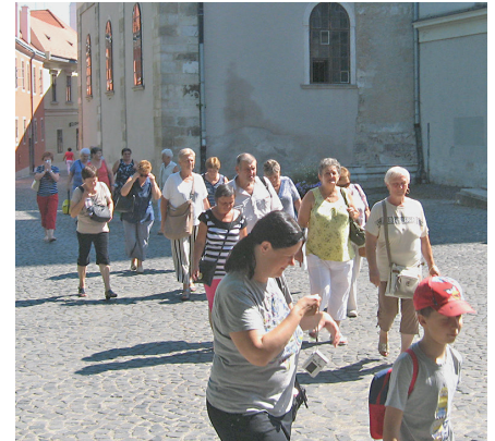
Közsgégtörténeti Baráti Kör győri kirándulása