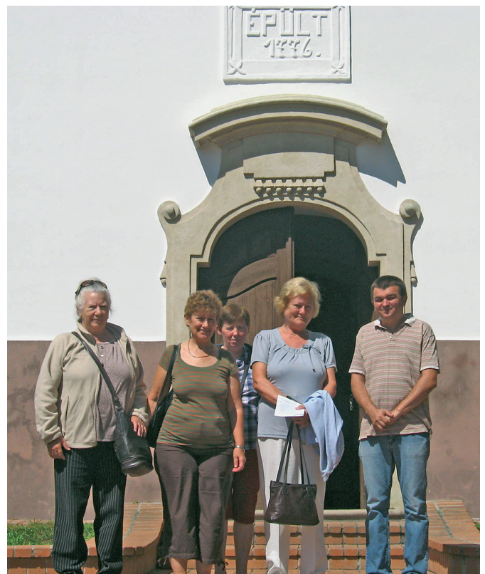
Magvető Klub Gombán