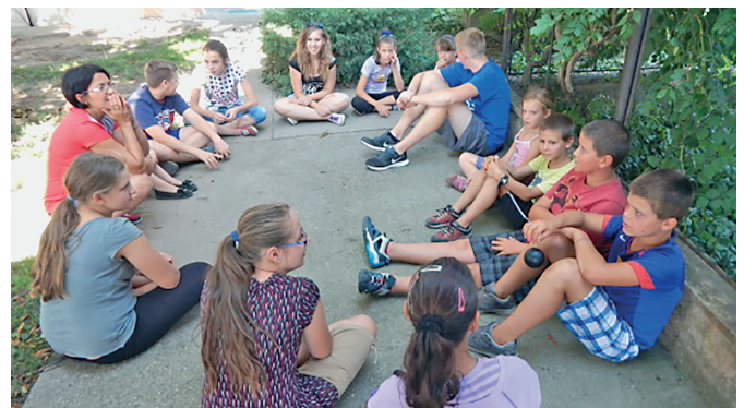
Református gyermeknapok – vetélkedő

Felelős kiadó: Szentmártonkátai Nagyközség Önkormányzata, Felelős szerkesztő: a Szerkesztőbizottság Engedélyszám: 571/1991. Nyomatott ISSN 2064-7689, Online ISSN 2064-7697, Megjelenik: 1800 példányban Nyomdai munkák: Tápió Nyomda Kft. +36 20/982-1180, +36 30/397-3559