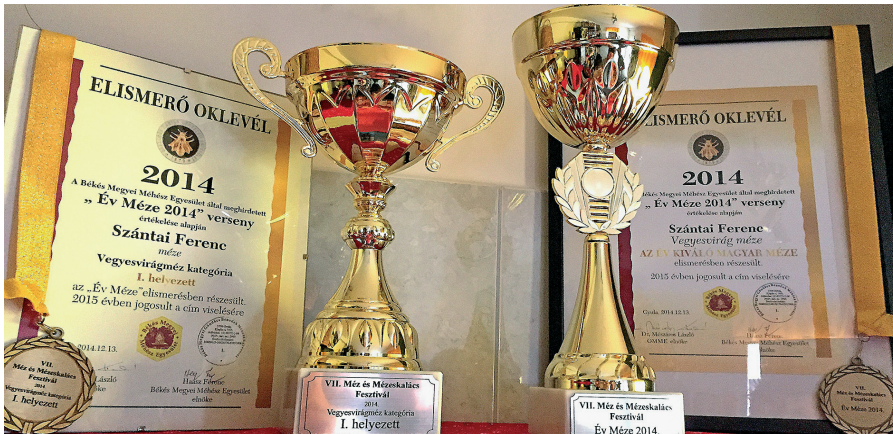
Szántai Ferenc méhész elismerései