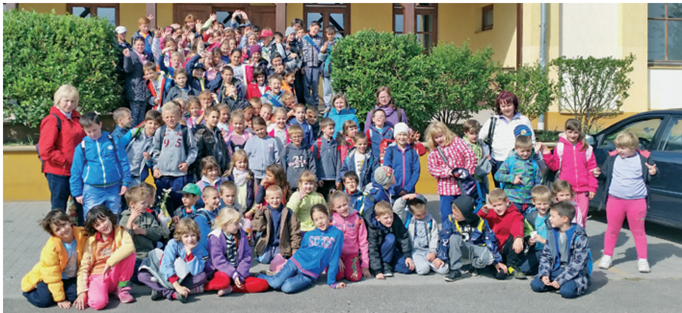
Szentmártonkátai Arany János Általános Iskola alsó tagozatának kirándulása