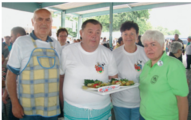
„Mártonkátá együtt főz” csapata, akik III. helyezést értek el