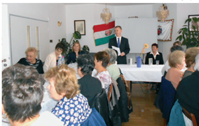
Nyugdíjas intézményi dolgozók találkozója