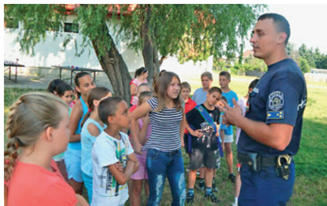
Szociális és Gyermekjóléti Szolgálat játszó tábora