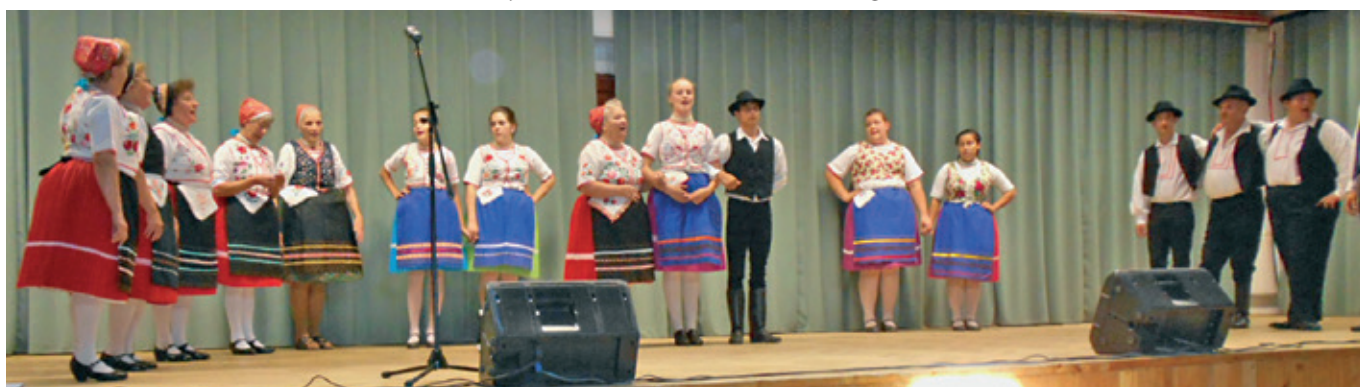
Nyugdíjas napi műsor