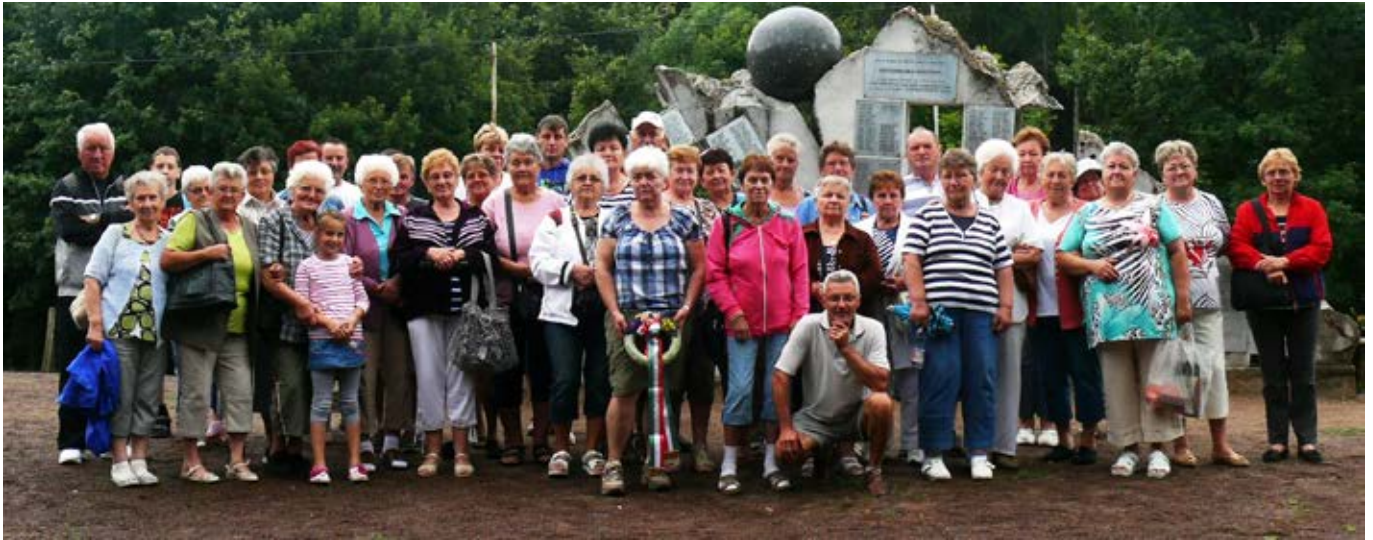
Nógrád megyében kirándult a Petőfi Klub