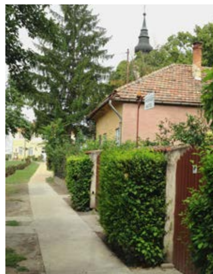
A katolikus templomtól a posta irányába halad a járda nyomvonala