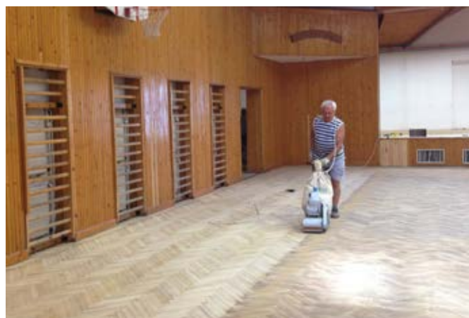
Tanévkezdésre megújul a burkolat a tornateremben