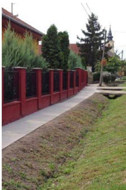
Elkészült az új járda a Bajcsy-Zs. úton

törekszik helyi vállalkozók bevonásával megvalósítani a beruházást. Mindezeket alapul véve, érthetetlen a település lakosságának egészségügyi ellátását szolgáló – beruházások „elutasítása” egy-egy képviselőtől, főként úgy, hogy korábban a fenti döntéseket még támogatta.