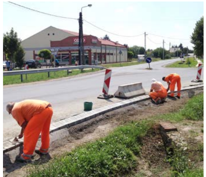
A szalagkorlát után a szegélykő is készül a szecsői kanyarban