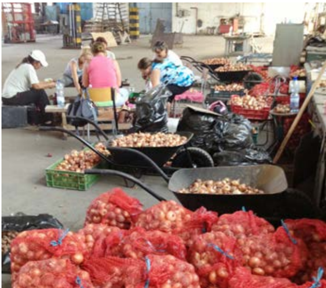
Válogatják a hagymát a Klimában a Mezőgazdasági program keretében