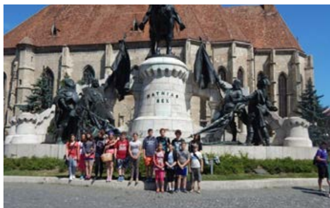
Székely József Református Általános Iskola tanulói Kolozsváron kirándultak