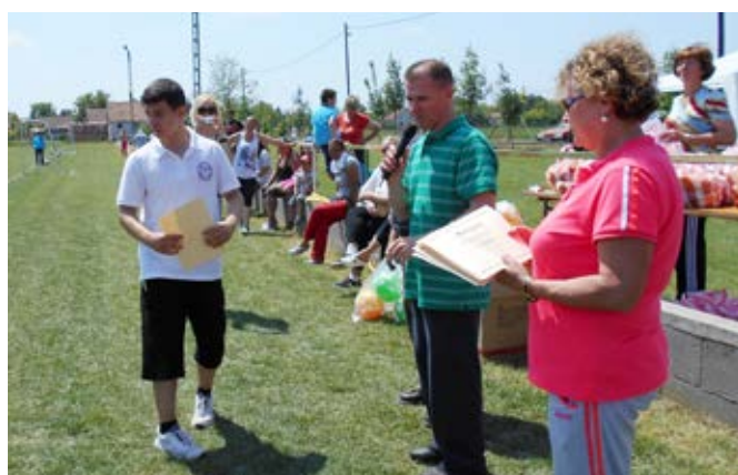
Eredményhirdetés a sportnapon