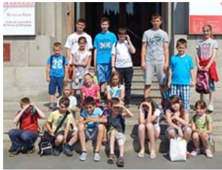
A 2014/2015-ös tanév legeredményesebb tanulóinak jutalom kirándulást szerveztünk Hollókőre és Budapestre!

Maradandó emlékeink közé soroljuk a sétát Nagyváradon és Kolozsváron, a