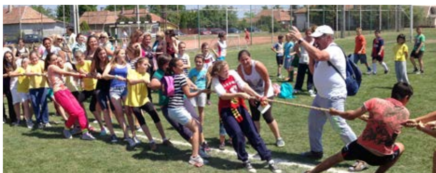
Népszerű volt a kötélhúzás is a Sportnapon