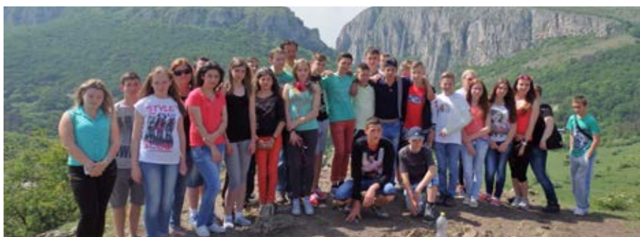
Szentmártonkátai Arany János Általános Iskola tanulói Erdélyben kirándultak