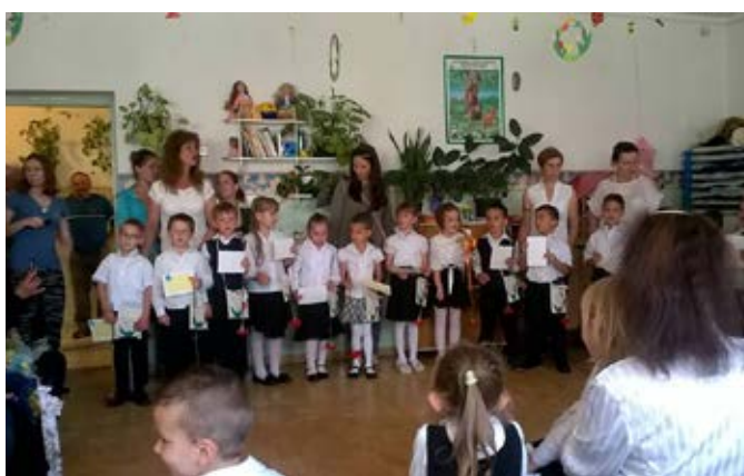
Ballagás az Aprajafalva Óvodában