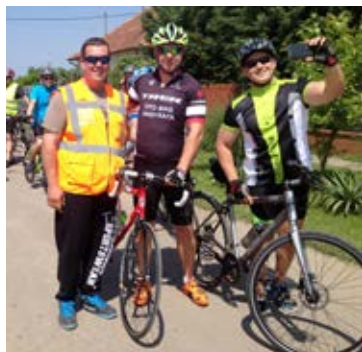
Még egy utolsó selfie indulás előtt

A nap sikerességéhez, a résztvevők mellett, nagyban hozzájárultak mindazok, akik munkájukkal vagy adománnyukkal támogatták a rendezvényt.