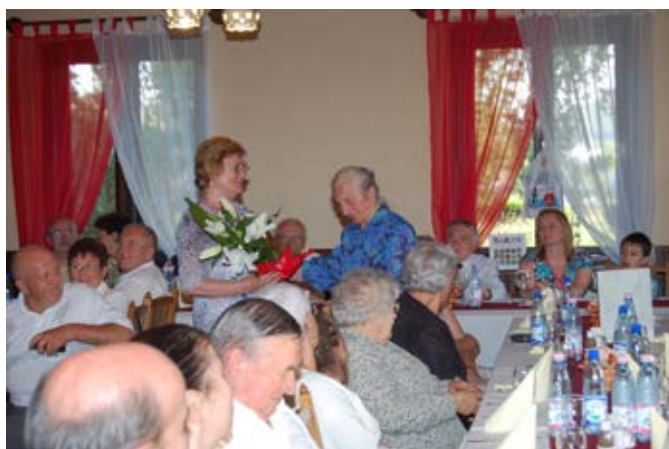
A Községtörténeti Baráti Kör 25. évfordulója