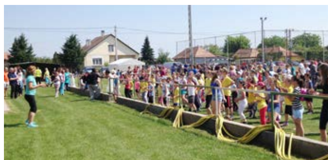
Tömegeket vonzott idén is a községi Sportnap