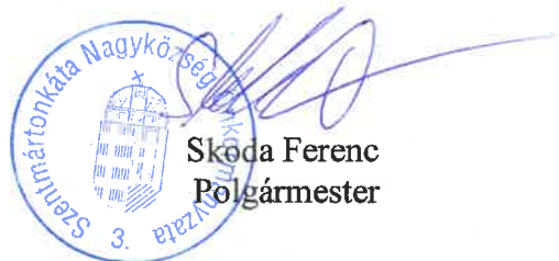
Skoda Ferenc Polgármester