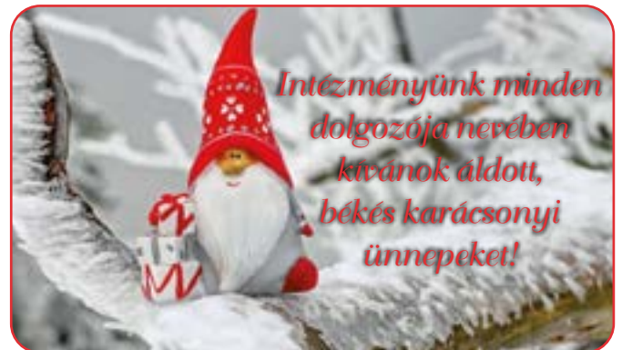
Ujvári Judit Intézményvezető