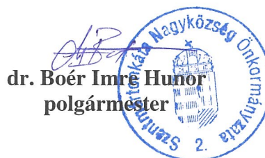
dr. Boér Imre Hunor polgármester