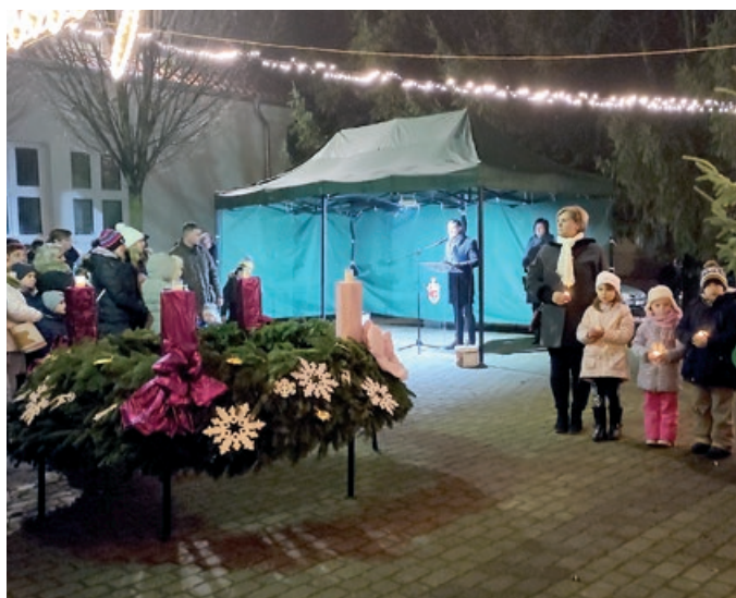
Advent második vasárnapja