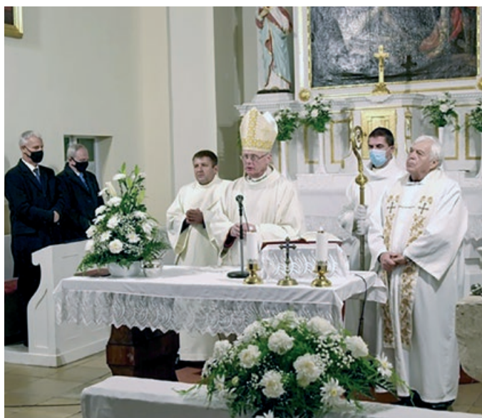
A megújult Szent Márton katolikus templom megáldása és átadása