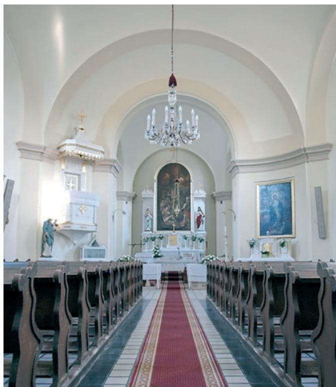
A megújult Szent Márton katolikus templom