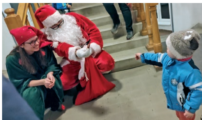
Polgármesteri hivatalba is ellátogatott a Mikulás