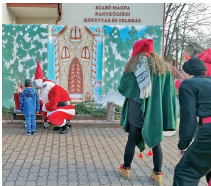
Készíts szelfit a Mikulással, könyvtári program