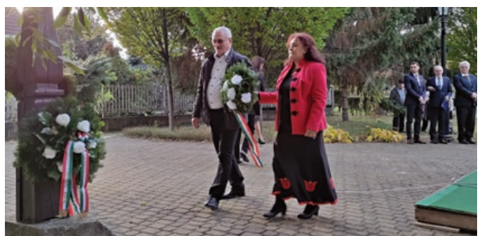
Koszorúzás az 1956-os kopjafánál