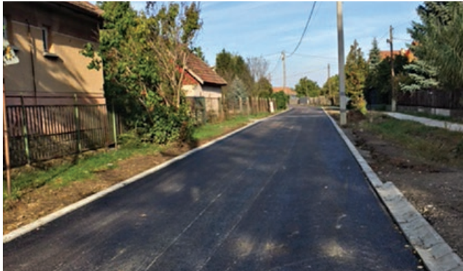
Az elkészült Battha Sámuel utca