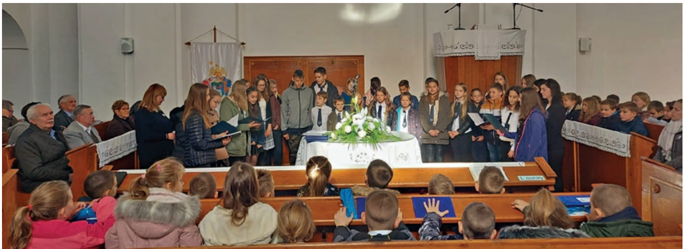
Székelly József Református Általános Iskola reformáció ünnepi istentisztelet