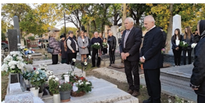
Koszorúzás Kiss Kálmán sírjánál