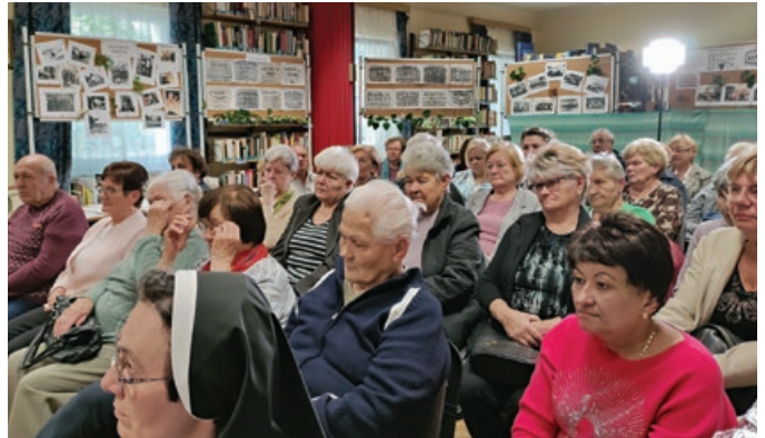
Szécsényi Erzsébet életútját bemutató kiállítás