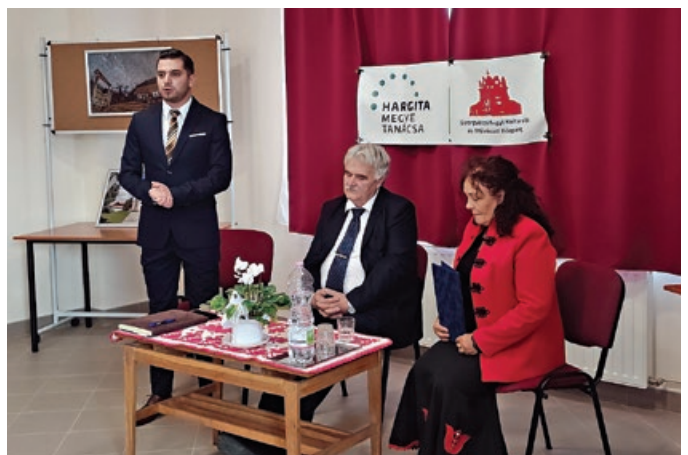
Gyergyószárhegyi Kulturális és Művészeti Központ Festő és Művészklub vándorkiállításának megnyitója