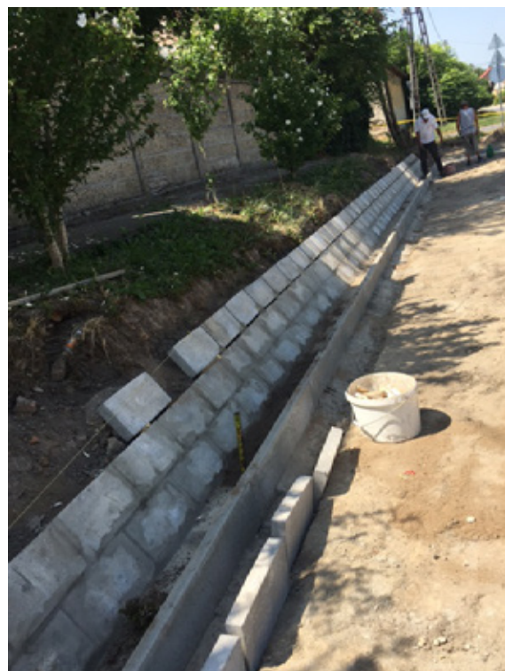
Vízvezető árok készül a Somogyi Béla utca elején