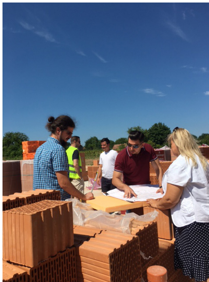
Egyeztetés a bölcsőde építésénél