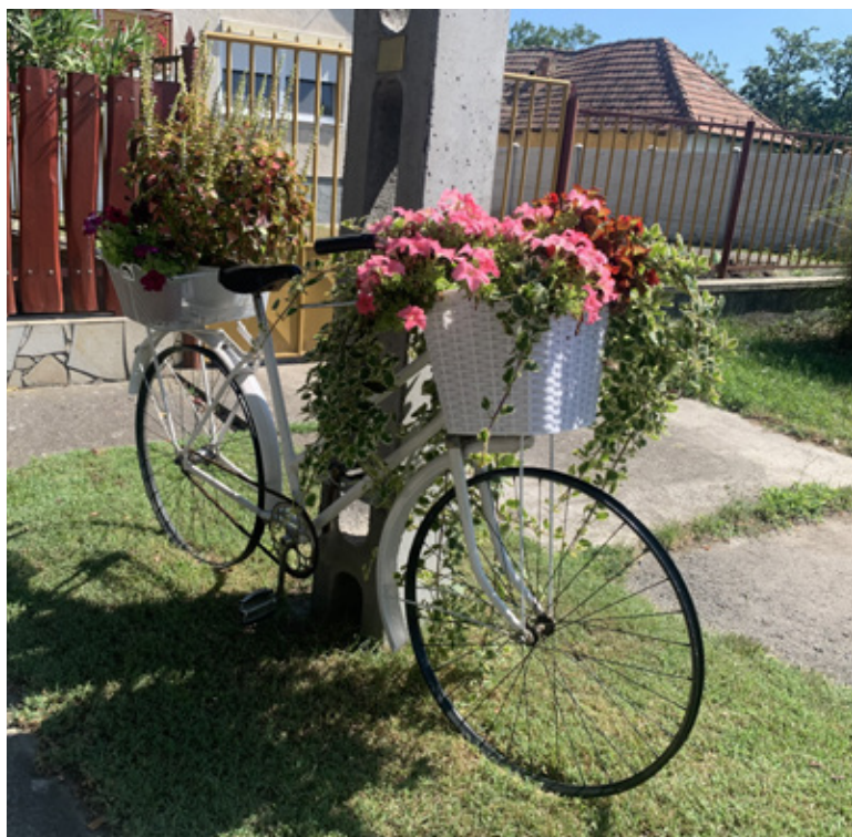
Települési látkép a Szecsői úton