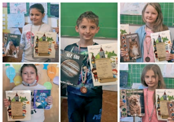
A Szentmártonkátai Arany János Iskola díjazott tanuló a Meselovagok Napja versenyen