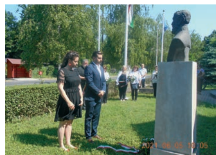
Koszorúzás a Battha-szobornál