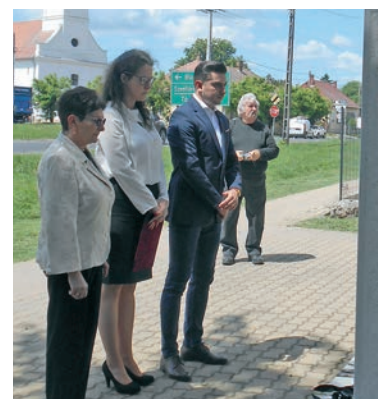
Megemlékezés a Hősök ligetében