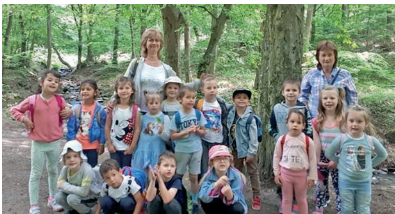
A Mátrában kirándult az Aprajafalva Óvoda