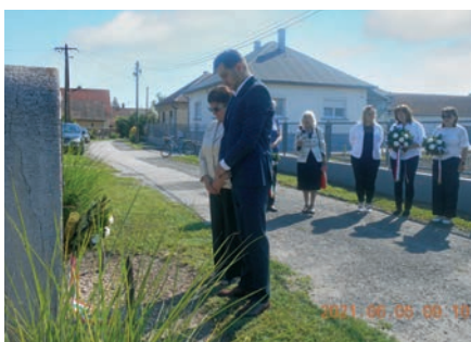
Megemlékezés a Kossuth-emlékhelynél