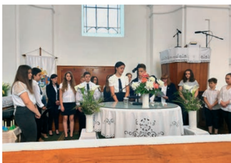
A Székely József Református Általános Iskola tanulóinak köszöntése pedagógusnap alkalmából