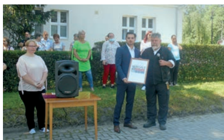
Tavaszi Hadjárat eseménysorozat településünkön