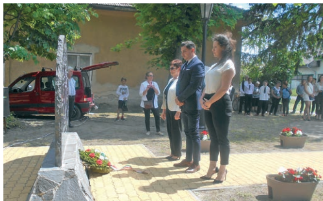
Koszorúzás és megemlékezés a Trianoni emlékműnél