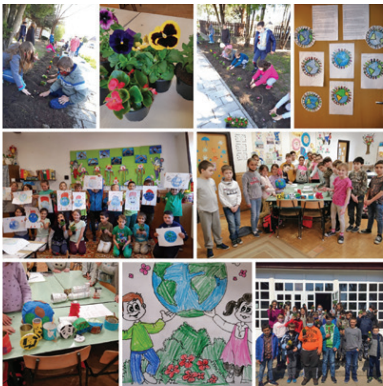
Szentmártonkátai Arany János Általános tanulói