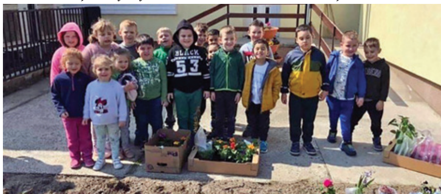
Ültetés az Aprajafalva Óvodában