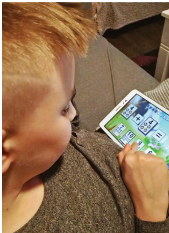
Az EGYMI diákjai tableten gyakorolnak