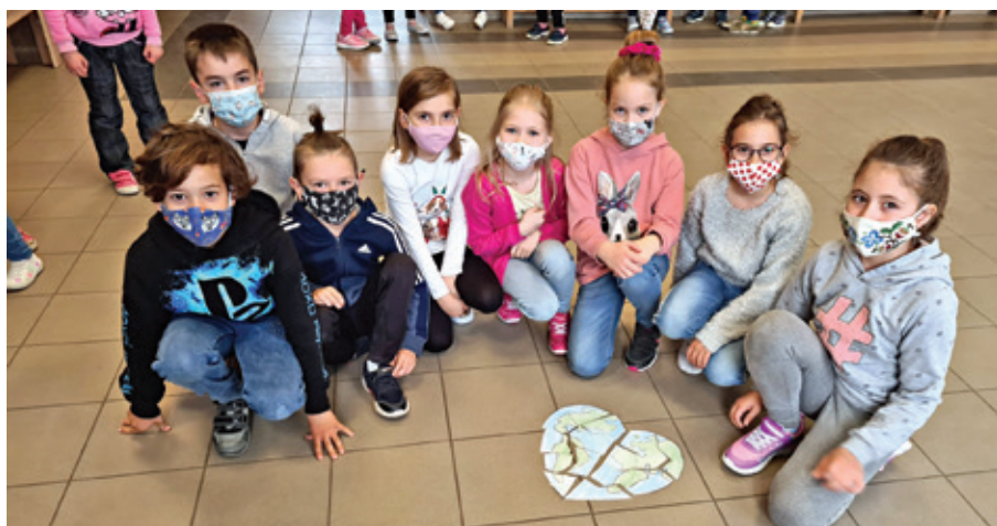
Székey József Református Általános Iskola 2. osztályos tanulói