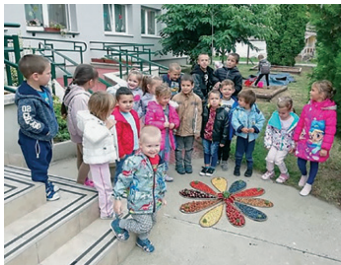
Terméskép készítés az Aprajafalva Óvodában