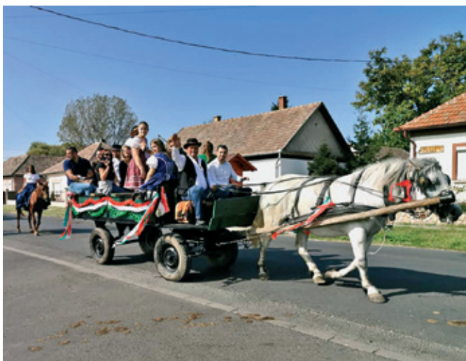
A Lovas Baráti Kör felvonulása