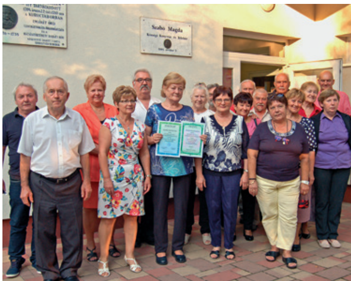
A Magvető Klub 50. évfordulója