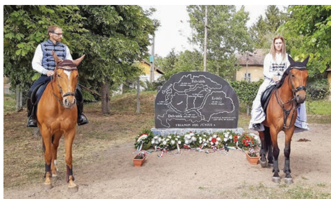
A Szentmártonkátai Lovas Baráti Kör tagjainak közreműködése a trianoni emlékmű avatásán