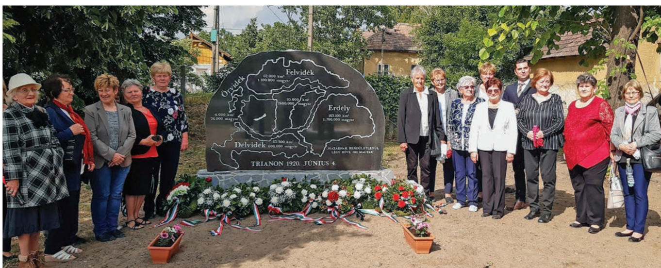
A Községtörténeti Baráti Kör tagjai a Trianoni emlékmű avatáson

Felelős kiadó: Szentmártonkátai Nagyközség Önkormányzata, Felelős szerkesztő: a Szerkesztőbizottság Engedélyszám: 571/1991. Nyomtatott ISSN 2064-7689, Online ISSN 2064-7697, Megjelenik: 1650 példányban Nyomdai munkák: Tápió Nyomda Kft. +36 20/982-1180, +36 30/397-3559