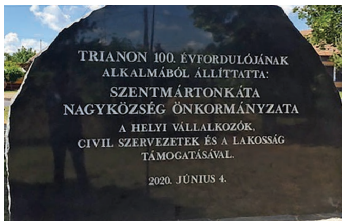
Az emlékmű hátoldalán a támogatók olvasható