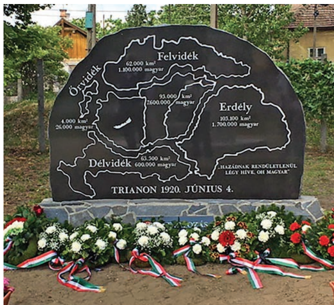
A Trianoni 100. évfordulója alkalmából állított összetartozás emlékmű