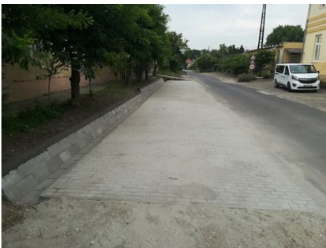
Elkészült a Református Templom mellett a térkő borítású parkoló