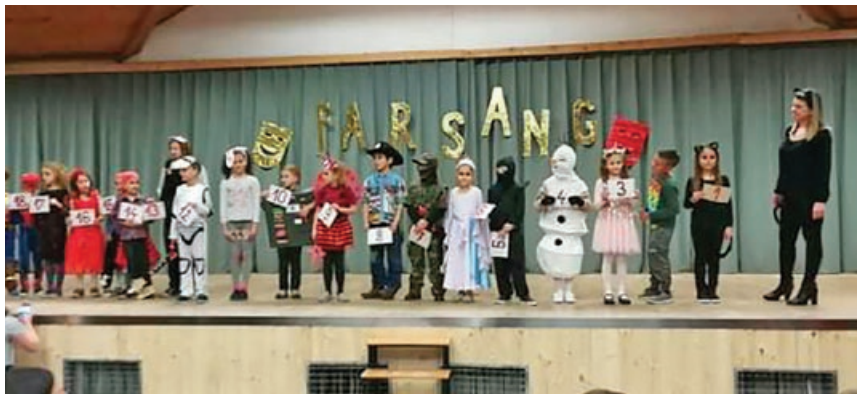
A Szentmártonkátai Arany János Általános Iskola tanulói az alsós farsangon