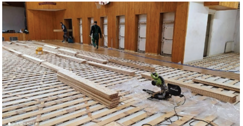
Megújult a Szentmártonkátai Arany János Általános Iskola tornaterme