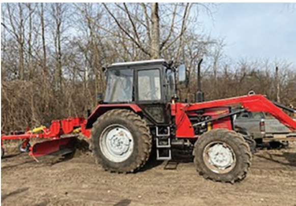
Munkába álltak az önkormányzat munkagépei