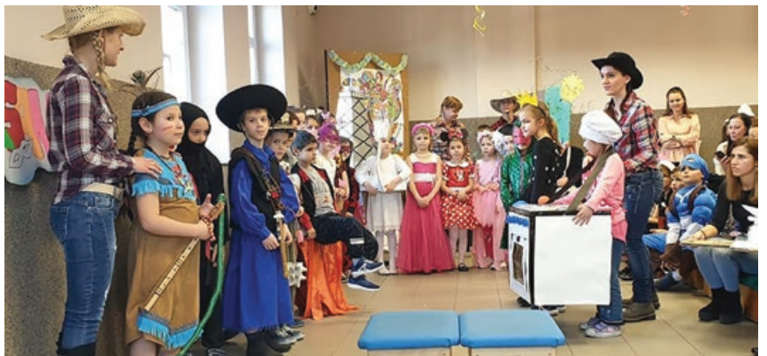
Székely József Református Általános Iskola tanulói farsangi bálon