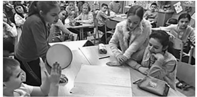
Székely József Református Általános Iskola tanulói: A magyar kultúra napja csapat vetélkedő

Közösség építő programként 4. osztályosaink Budapesten Az ólomkatona c. előadást tekintették meg a Turay Ida