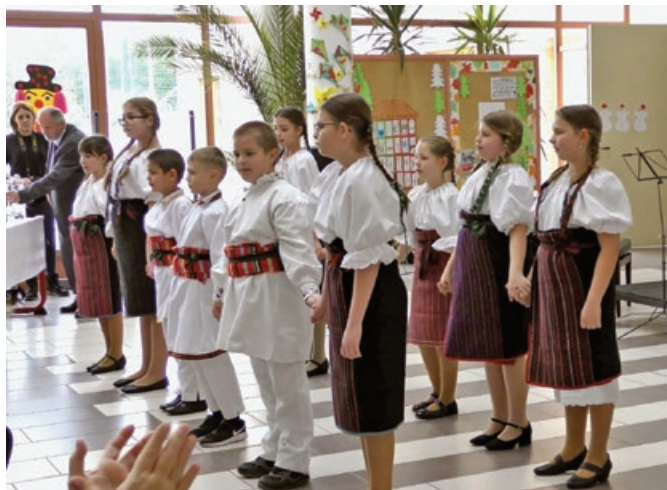
A Szentmártonkátai Arany János Ált. Isk. a térségi Ki mit tud?-on a néptáncsoportunk ezüst minősítést kapott