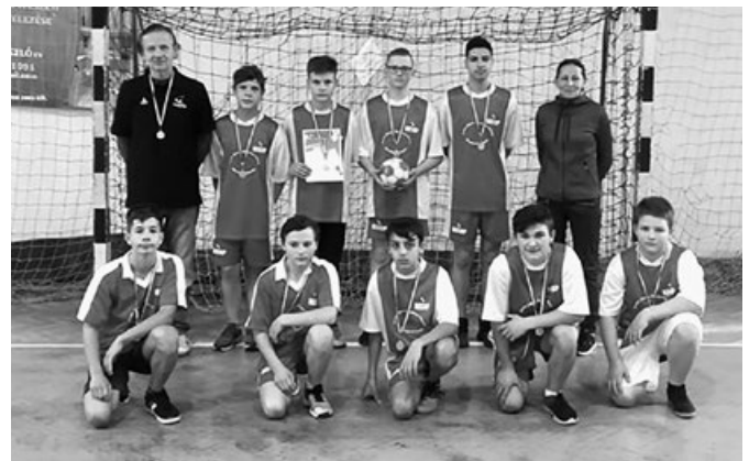
A Szentmártonkátai Arany János Ált. Isk. a IV. korcsoportos fiúkézilabda csapat a Diákolimpián ezüstérmel szerzett

A pedagógusok számára továbbképzéssel indult az év. A jelen tanévben bevezetett „Boldogságóra” programhoz kapcsolódóan öt pedagógus vehetett részt az óvó nénikkel közös továbbképzésen a Szent-