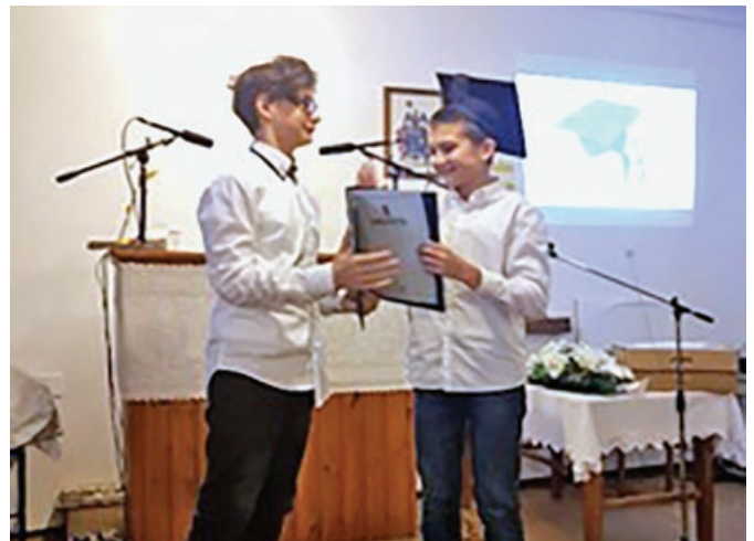
Székelly József Református Általános Iskola tanulójának emlék műsora