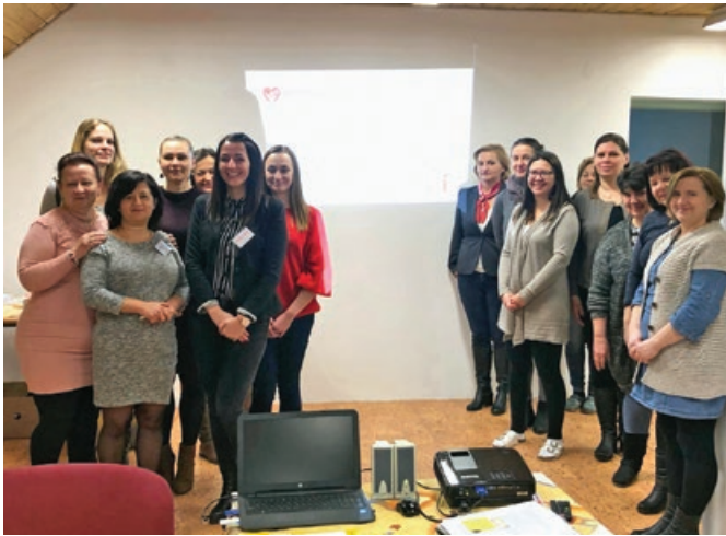
Továbbképzés az Aprajafalva Óvodában