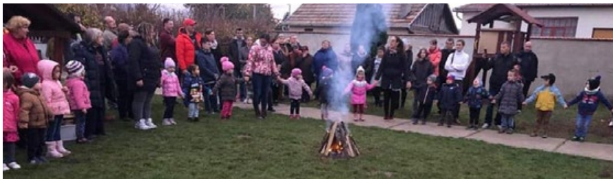
Márton-napi rendezvény az Aprajafalva óvodában