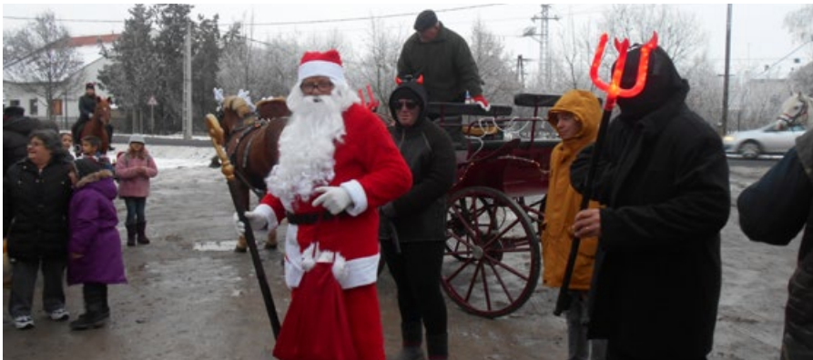
Szentmártonkóta Lovasok Baráti Köre Mikulás-napi lovas felvonulása