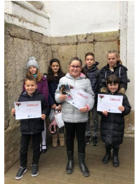
Székely József Református Általános Iskola Tanulói a kunhegyesi Országos Adventi Szavaló-és Dicséreténeklő Versenyen