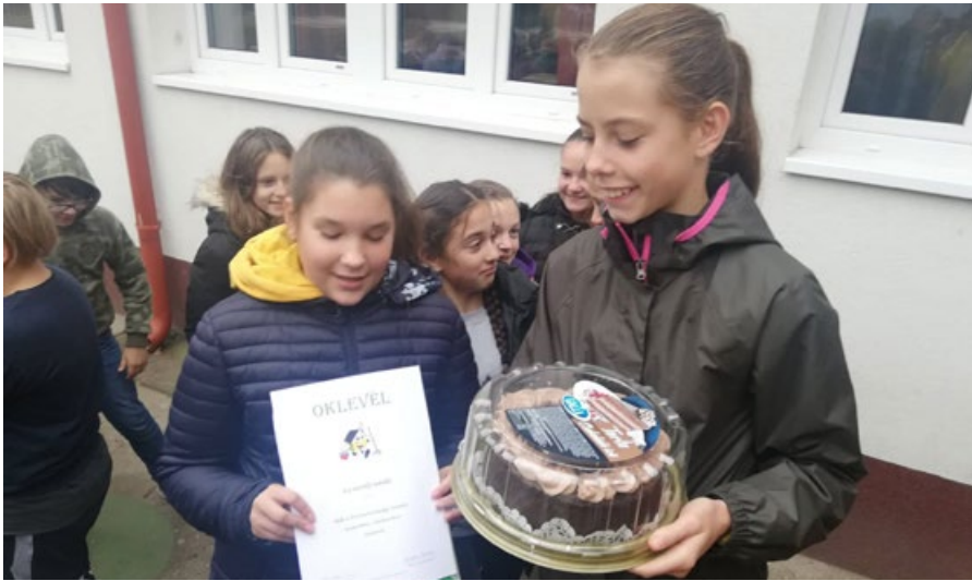
Teremtisztasági verseny győztes osztálya a 6.a ( Arany János Ált. Isk.)