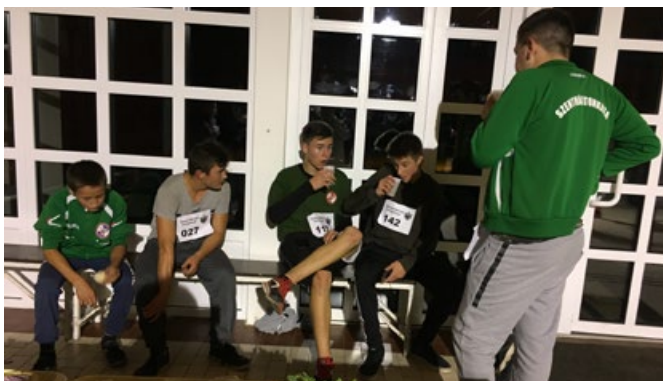
Szent Márton emlékfutás résztvevői a beérkezés utáni vendéglátáson