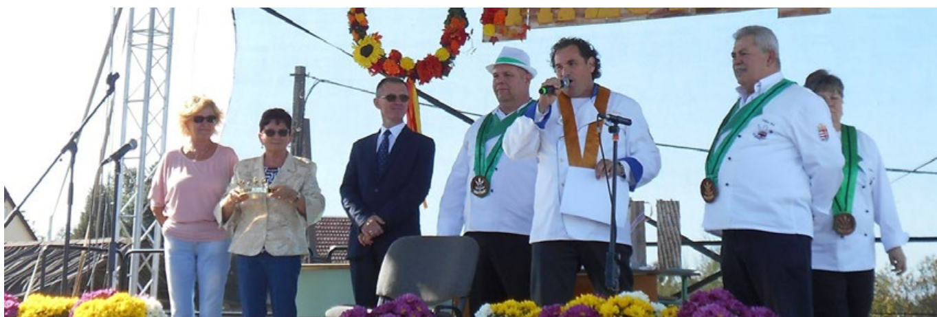
Étel lovagok eredményhirdetése a falunapon