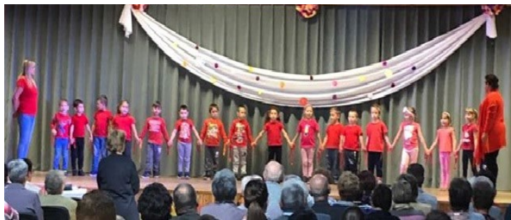
Az Aprajafalva Óvoda műsora az idősek napján