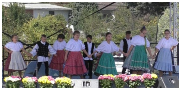
Szentmártonkátai Arany János Ált. Isk. a falunapon