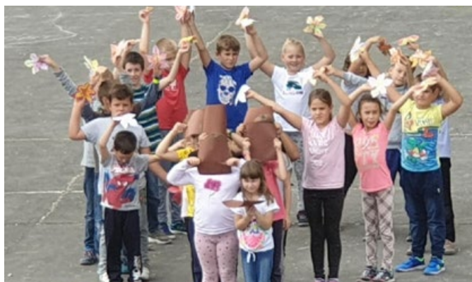
Székely József Ref. Ált. Isk. 2. oszt. tanulói Geszti parti őszi élőképe