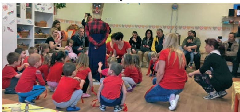
Farsang az Aprajafalva Óvodában