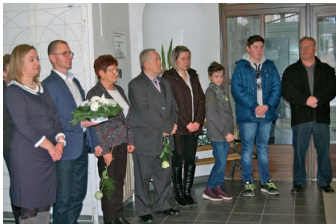
A Karai István emléknapon a község vezetői és a családtagok