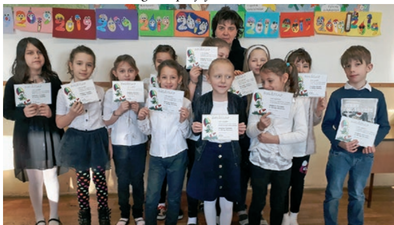
Szentmártonkátai Arany János Ált. Isk. tanulói a NyelÉsz versenyen