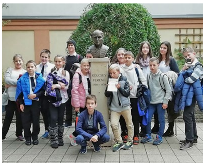
A Székely József Református Általános Iskola tanulói Református Iskolák XXII. Országos Tanulmányi Versenyén Debrecenben