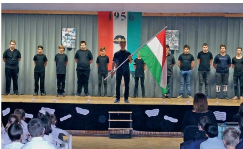
A Szentmártonkátai Arany János Általános Iskola 1956-os megemlékezése