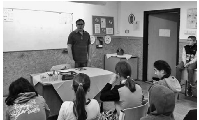
Pályorientációs nap a

Autogramgyűjtést követően közös fotózkodás zárta a napot.