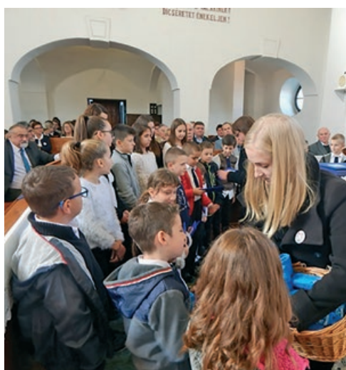
A Székely József Református Általános Iskola tanulói emléklapot és az iskola pólókat kaptak az ünnepi istentiszteleten