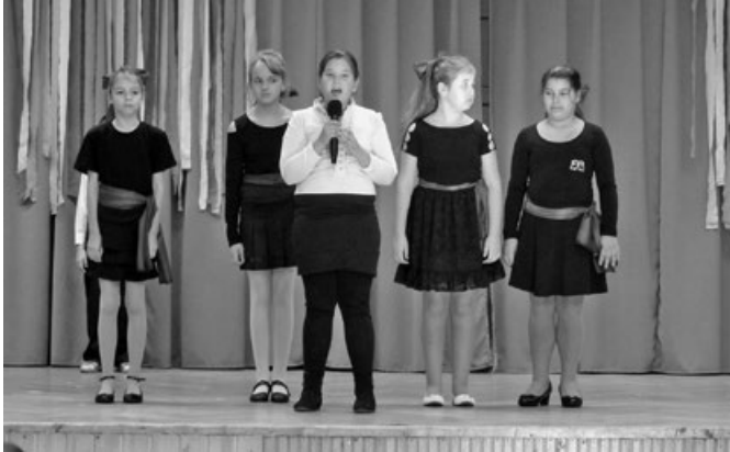
Idősek napja a

Szentmártonkátai Arany János Általános Iskolában