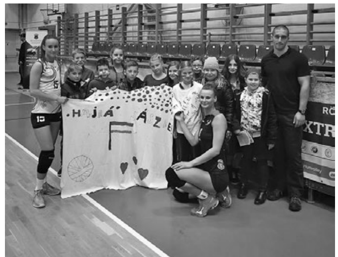
Röplabda mérkőzésen a Szentmártonkátai Arany János Általános Iskolában az 5/b osztályos tanulói

Szentmártonkátai Arany János Általános Iskolában