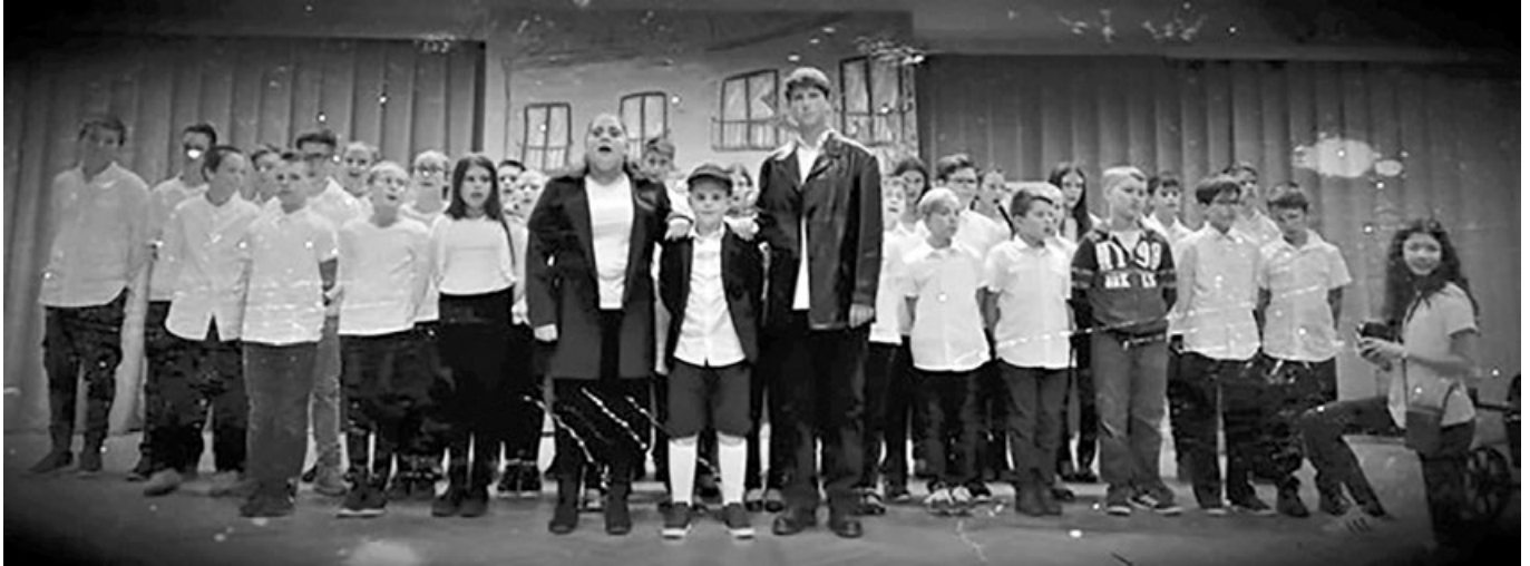
A Székely József Református Általános Iskola tanulói az 1956-os forradalom és szabadságharc 62. évfordulója alkalmából tartott nagyközségi ünnepségen