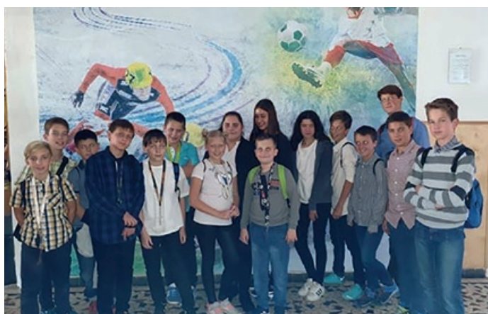
A Székely József Református Általános Iskola tanulói Bolyai matematika csapatversenyen