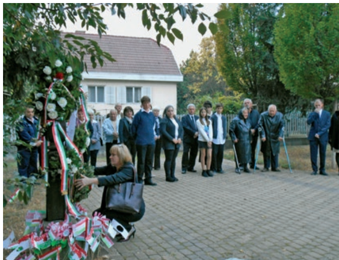
Koszorúzás a Szent Márton-emlékparkban az 1956-os kopjafánál