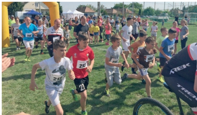
Szentmártonkátá sportnapja: futóverseny résztvevői