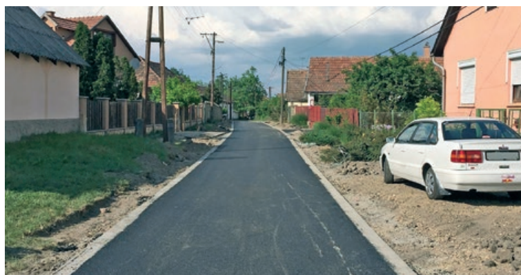
Folytatódtak az útfelújítási munkák a településen. Elkészült a Honvéd utca útburkolata a szegéllyel együtt.