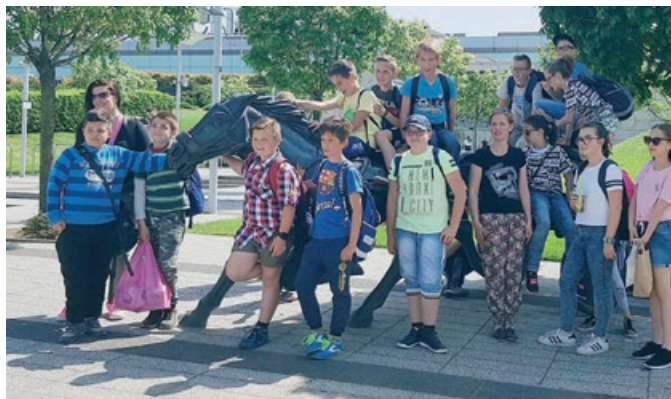
Az Arany János Ált. Iskola 5. b osztálya a jégkorong vb előtt