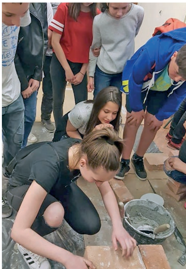
A Székely József Református Általános Iskola 7. osztályos tanulói a Szakmák éjszakáján