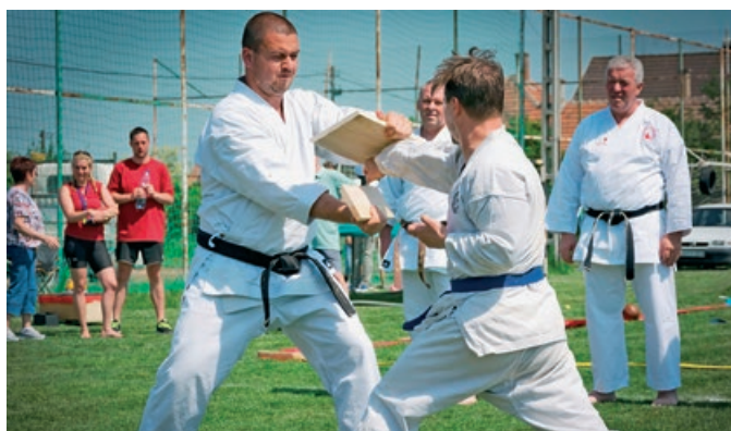
Szentmártonkátá sportnapja: karate bemutató