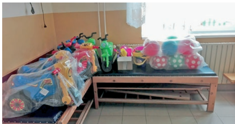
Diószegi Gyula ajándéka az Óvoda úti óvodának