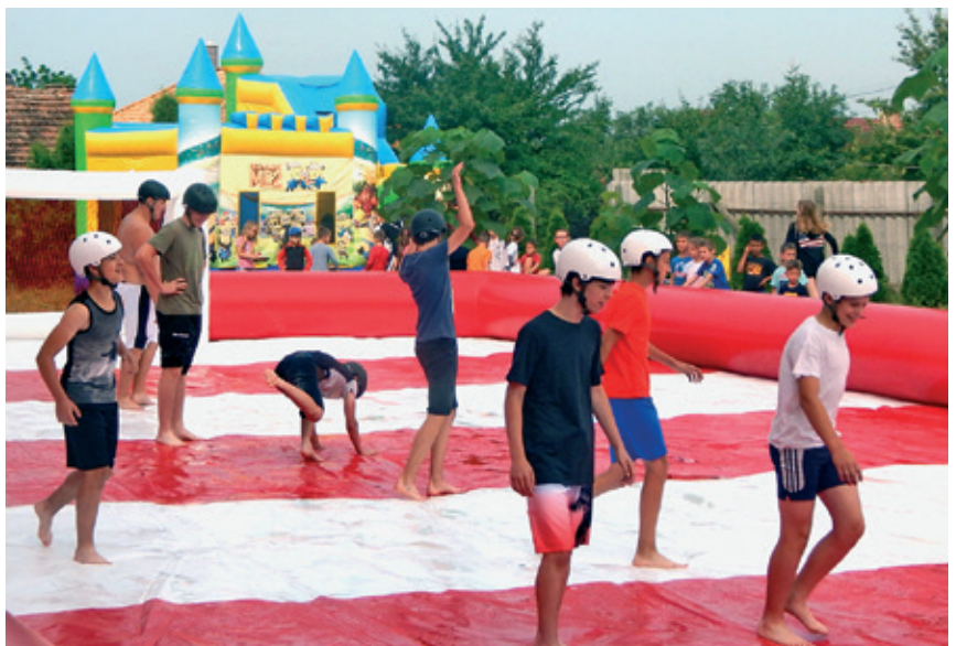
Gyereknap a Székely József Református Ált. Iskolában