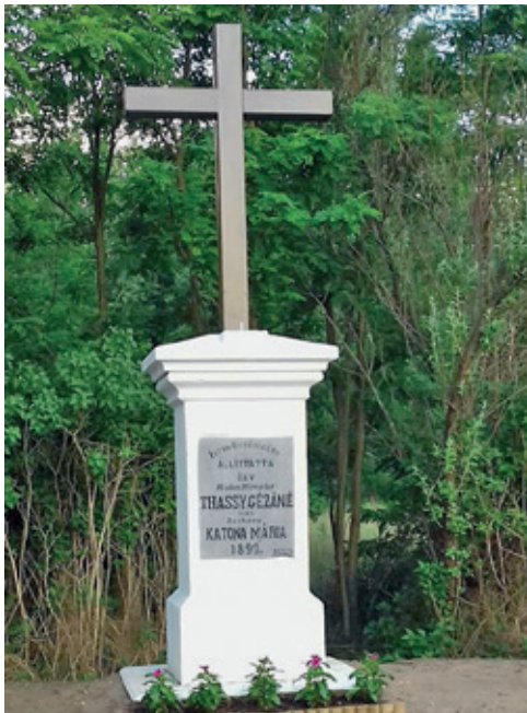
A felújított kőkereszt