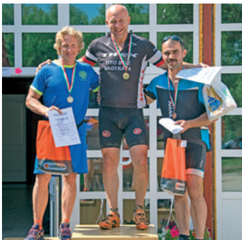
Tápió 25 kerékpáros verseny győztesei