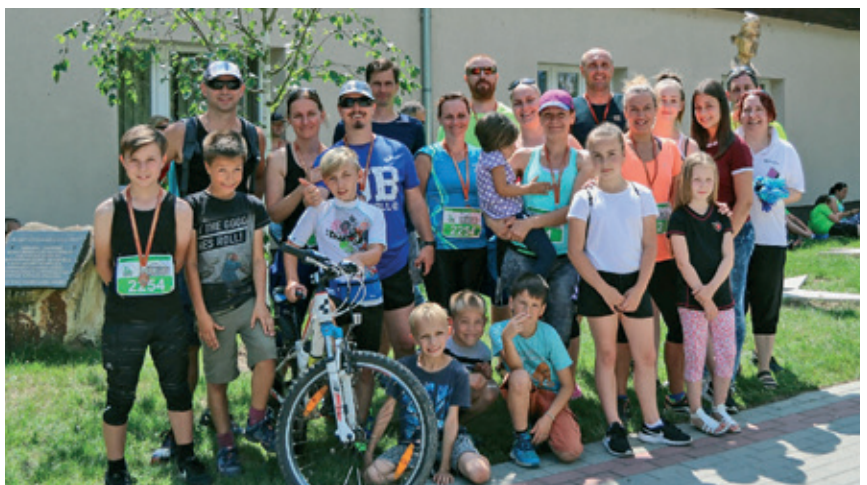
VII. Tápiómenti Maraton