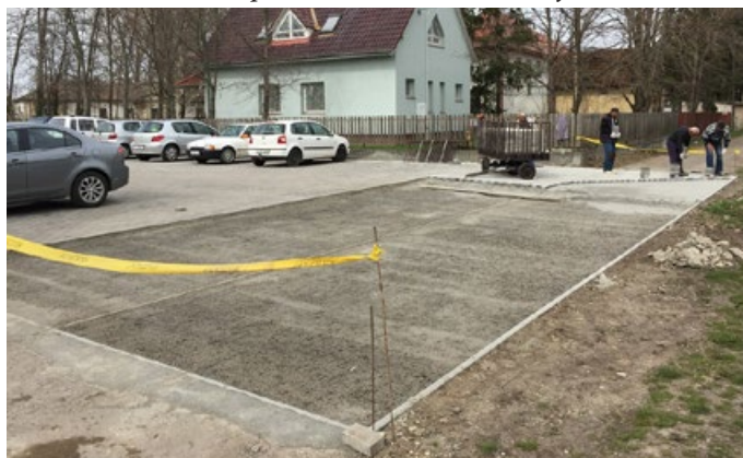
Idén is folytatódott a térkövezési program