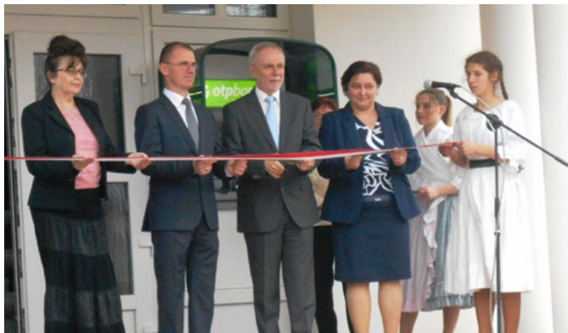
Energetikai beruházások átadása