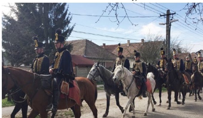
Lovas huszárok településünkön a Tavasz Hadjárat keretében