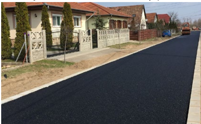
Elkészült a Márton utca aszfaltburkolata