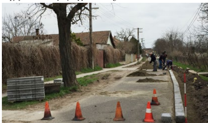
Az útépitési munkálatok a Temető utcában folytatódtak