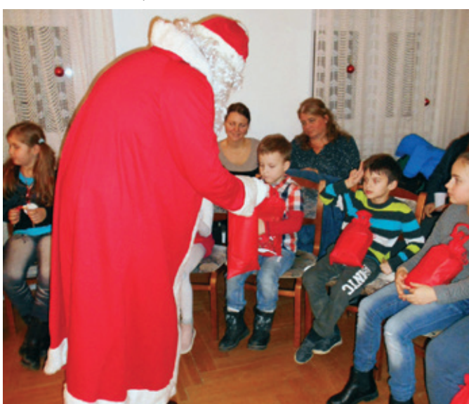
A polgármesteri hivatalba is ellátogatott a Mikulás