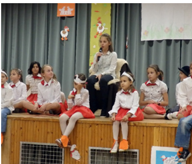
Márton-napi műsor a Szentmártonkátai Arany János Általános Iskolában