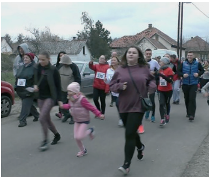
Szent Márton emlékfutás