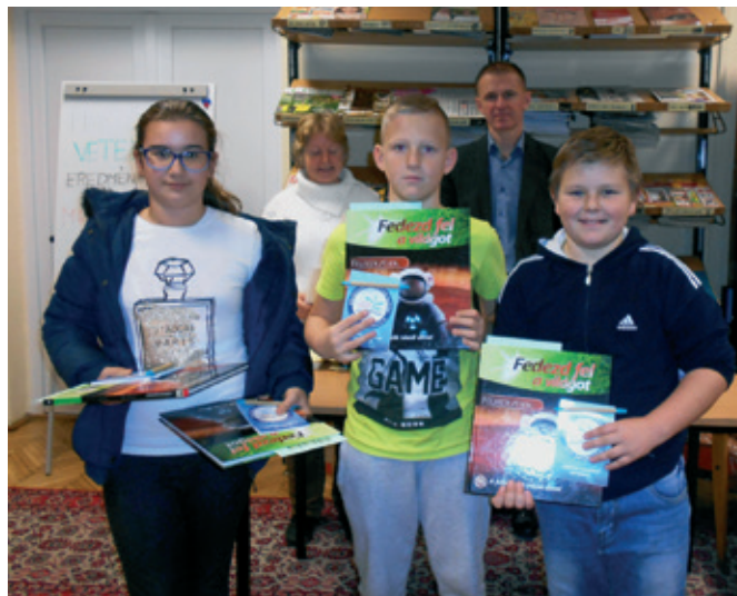
Márton-napi eredményhirdetés a Szabó Magda Könyvtárban