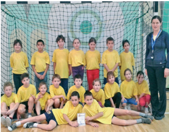
Játékos sport verseny a Szentmártonkátai Arany János Általános Iskolában