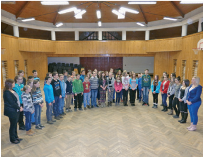
7. és 8. osztályos tanulók az Együtt szaval a Nemzet rendezvényünkön