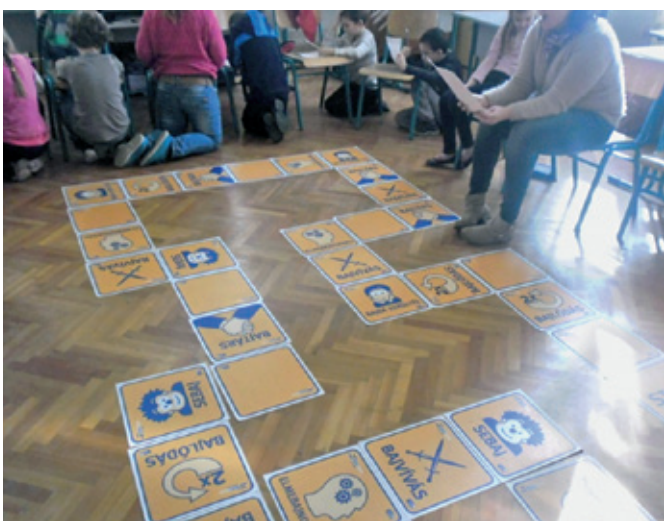
Biztibusz játék 2.o.