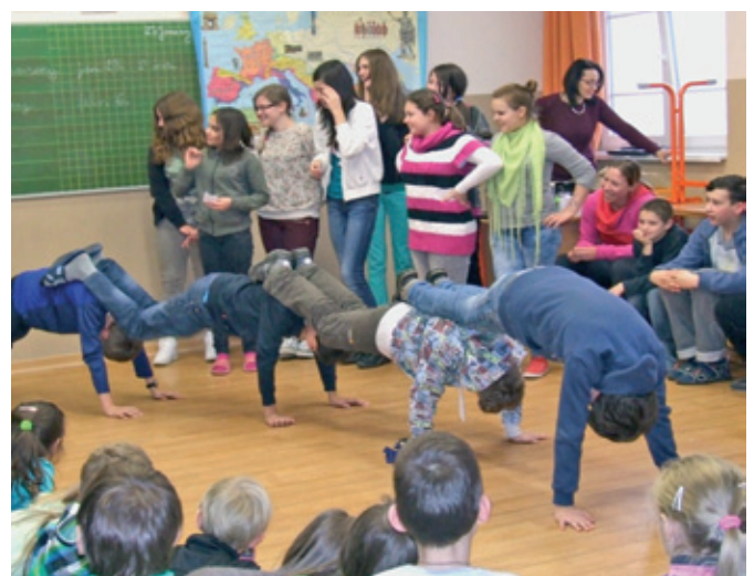
8. osztályosok bemutatója: „A hernyó”