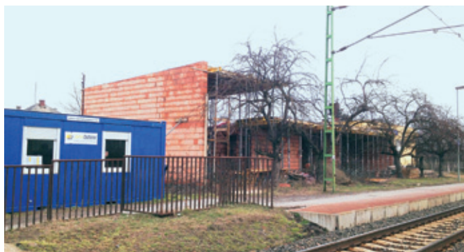
A tervek szerint idén nyáron birtokba vehetik az utazók az új állomás épületét

Nem volt hiábavaló önkormányzatunk részéről a helyi vasútállomás megépítésének szorgalmazása. Jónéhány levélben nyomatékosan kértük – bemutatva a vonatra várakozó ingázó lakosaink tarthatatlan problémáit –, hogy mielőbb kezdjék el az épület elkészítését. Nem fogadva el az érkező válaszlevelekbe foglalt magyarázatokat – miszerint előre nem látható műszaki akadályok, a közbeszerzés, az építési engedélyezési eljárás elhúzódása gátolta a munkálatokat – újabb és újabb levelet írtunk a MÁV Zrt. illetékeseinek. Végül – mikor már a hivatalos leveleinkre sem válaszoltak – személye-