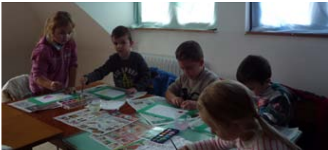
Óvodások a kézműves foglalkozáson