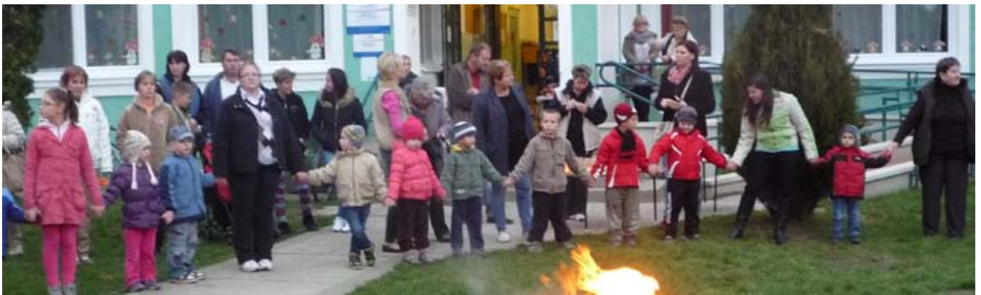
Márton-napi nyitóünnep az Aprajafalva Óvodában