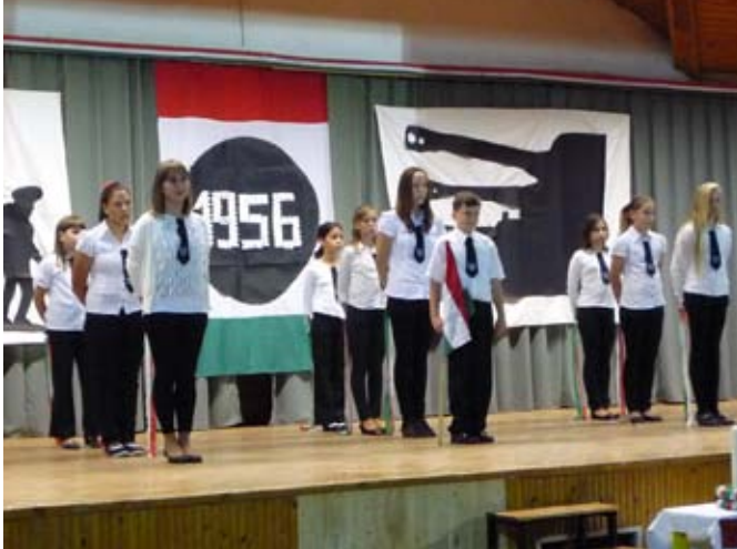
Székely József Református Általános Iskola ünnepi műsora