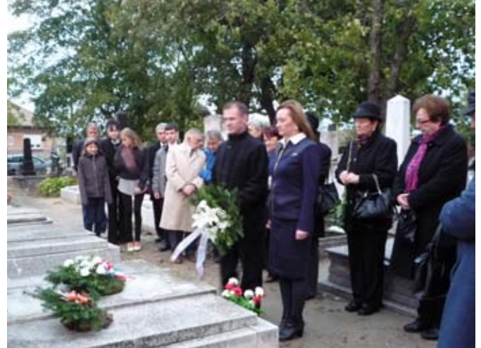
Koszorúzás Kiss Kálmán '56-os mártír sírjánál