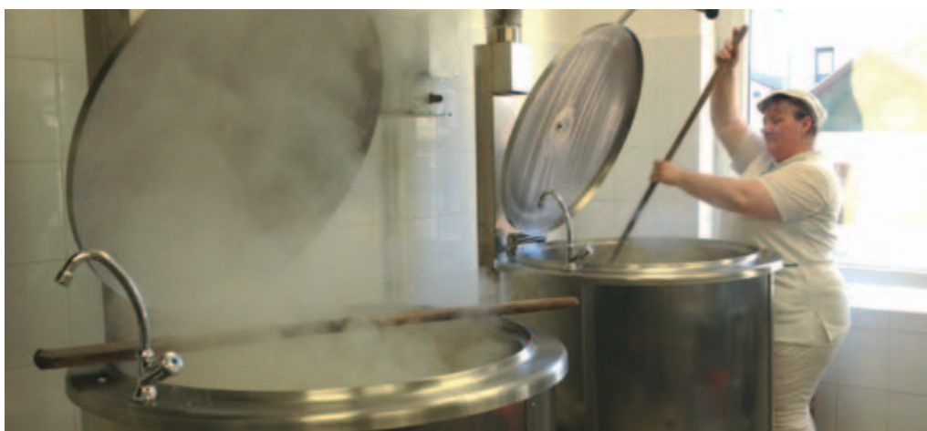
Készül az ebéd a gyerekeknek az új főzőüstökben