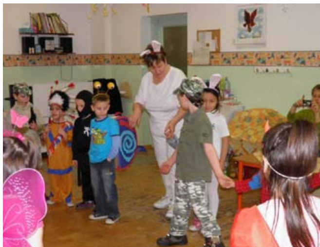
Farsang a pillangó csoportban