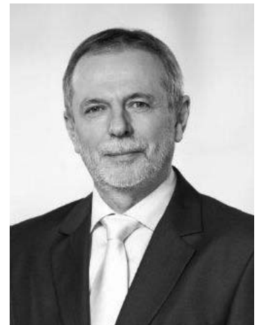
Czerván György Pest megye 9. sz. választókerület országgyűlési képviselője

Szentmártonkátának az elmúlt időszakban az EMVA III. tengely Falumegújítás- és fejlesztés jogcím keretében sikerült mintegy 5 millió forint pályázati forrást elnyernie játszótér építésére. A játszótér átadására a falunapon került sor, melynek megrendezéséhez szintén pályázati forrást kaptak 1 millió forint értékben.