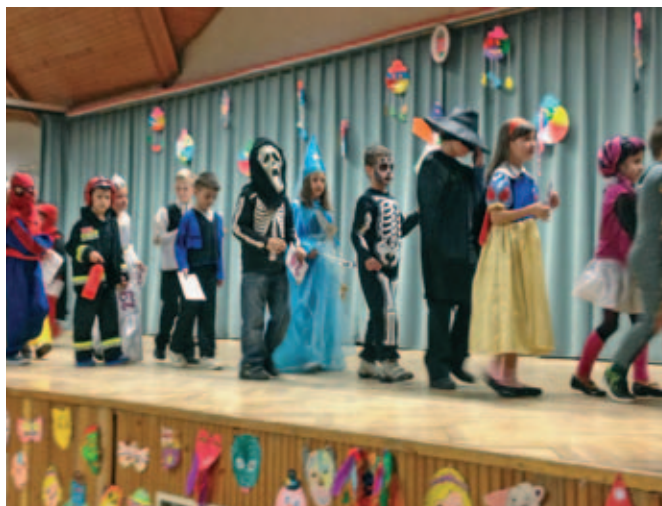
Farsangi jelmezes felvonulás a Szentmártonkátai Arany János Általános Iskola alsó tagozatán