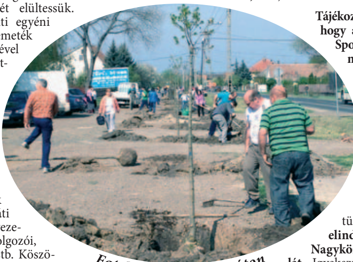
Fatelepítés a Szecsői úton