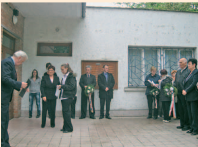
Megemlékezés II. Rákóczi Ferenc tiszteletére a Szabó Magda Nagyközségi Könyvtár és Teleház előtt