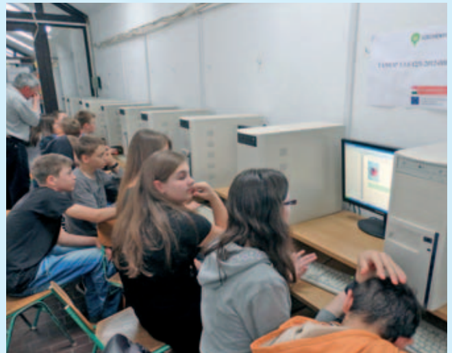
Föld napja vetélkedő