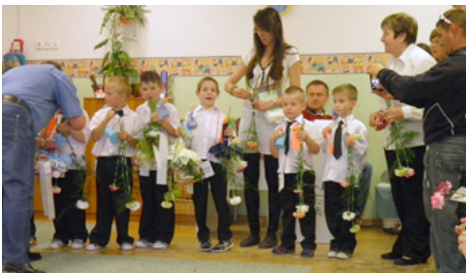
Ballagás az Aprajafalva Óvodában