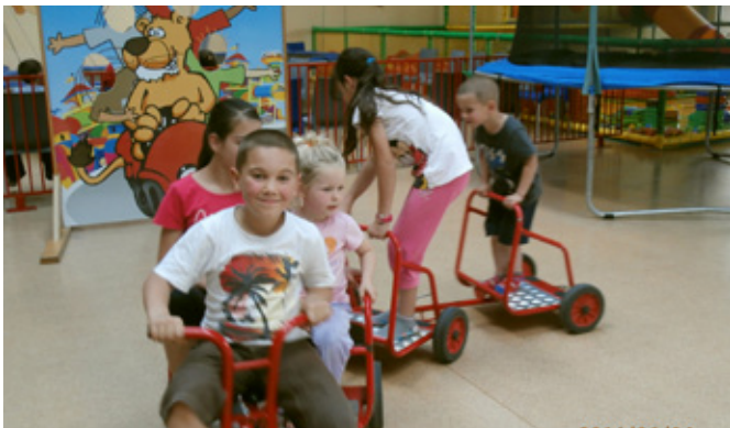
Aprajafalva Óvoda az Elevenparkban