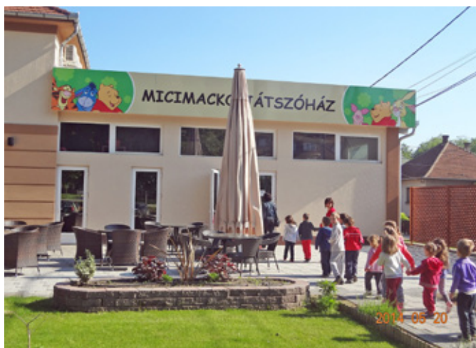
Megérkeztek az óvodások a játszóházba