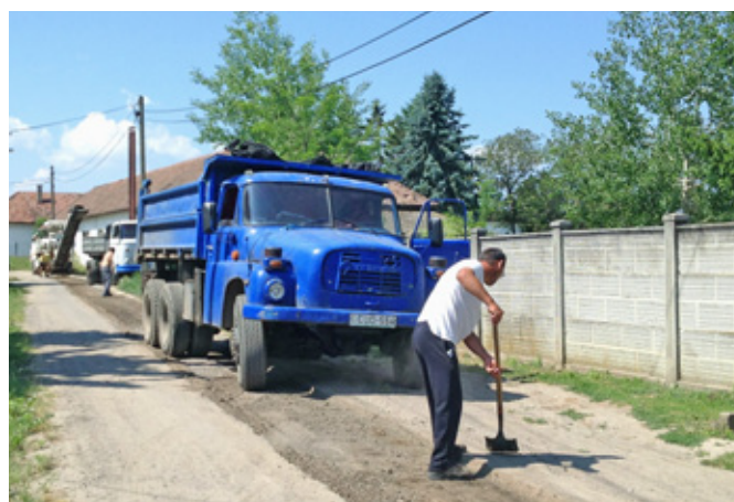
Megkezdődött az utak visszajavitása, aszfaltozása

Önkormányzatunk a korábbi évekhez hasonlóan most is 1.360.000 forinttal támogatja a gyermekek kirándulását. Ebből az összegből településünk minden iskolás és óvodás korú gyermeke után (Szentmártonkátai