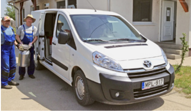
Munkában az új ételszállító autó