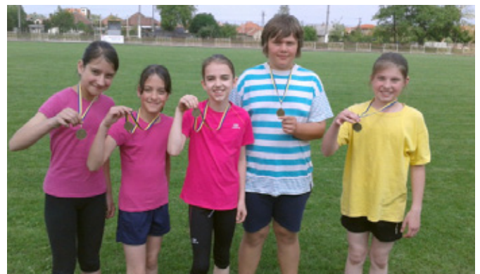
Sportsikerek az Arany János Általános Iskolában