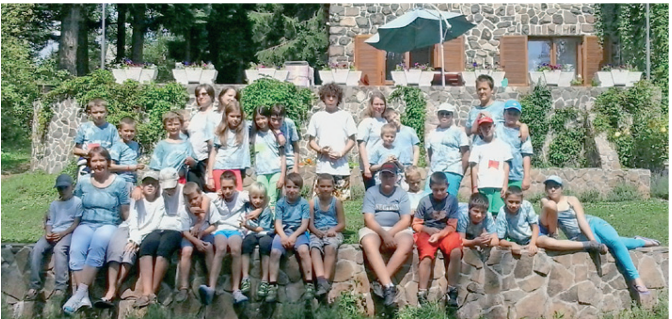
A hittantábor résztvevői Galyatetőn