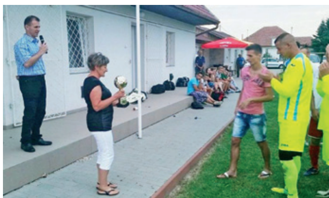
Fejős Pál Futball Emléktorna a sportpályán

2014. július 26-27-én második alkalommal került sor a FEJŐS PÁL Futball Emléktorna megrendezésére.