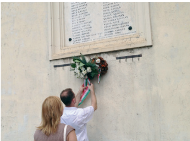
Koszorúzás az I. világháborús emléktáblánál