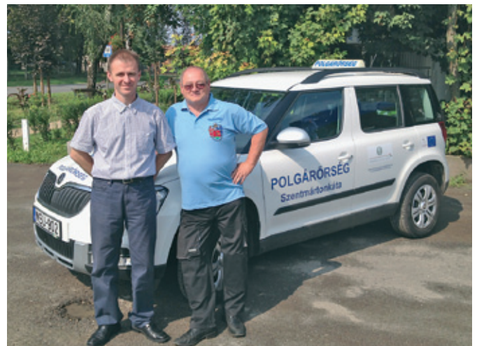
Polgárőrök új telepjárója