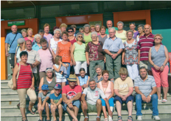
Nyíregyházán kirándult a Petőfi klub