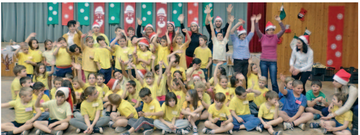
Mikulás kupa a Szentmártonkátai Arany János Általános Iskolában