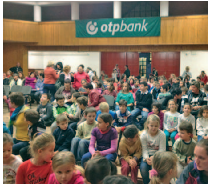
Márton-napi rendezvény, melyet az OTP Bank is támogatott