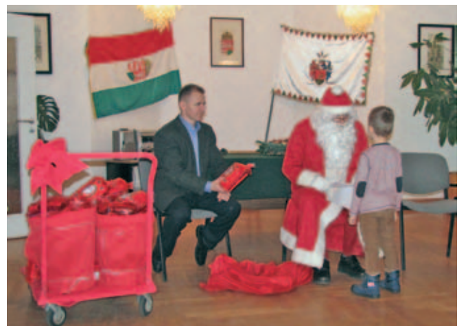
A polgármesteri hivatalba is ellátogatott a Mikulás