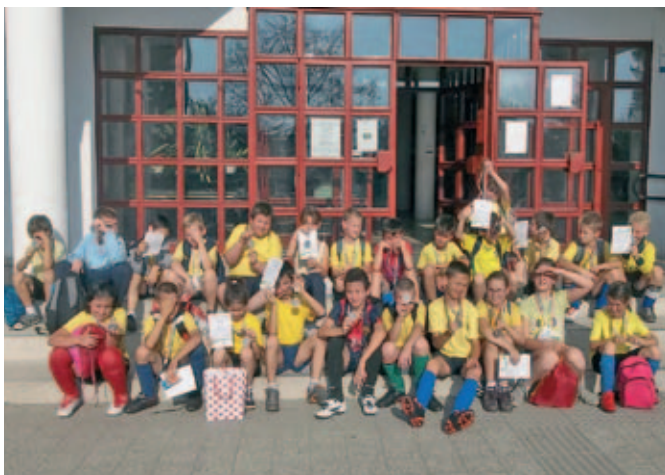
Szentmártonkátai Arany János Általános Iskola sportoló diákjai