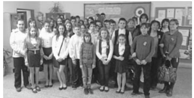
A dunamocsi diákokkal

Felejthetetlen két napot töltött Szlovákiában a Székely József Református Általános Iskola 19 diákja és két kísérő pedagógusa március 15-én és 16-án.