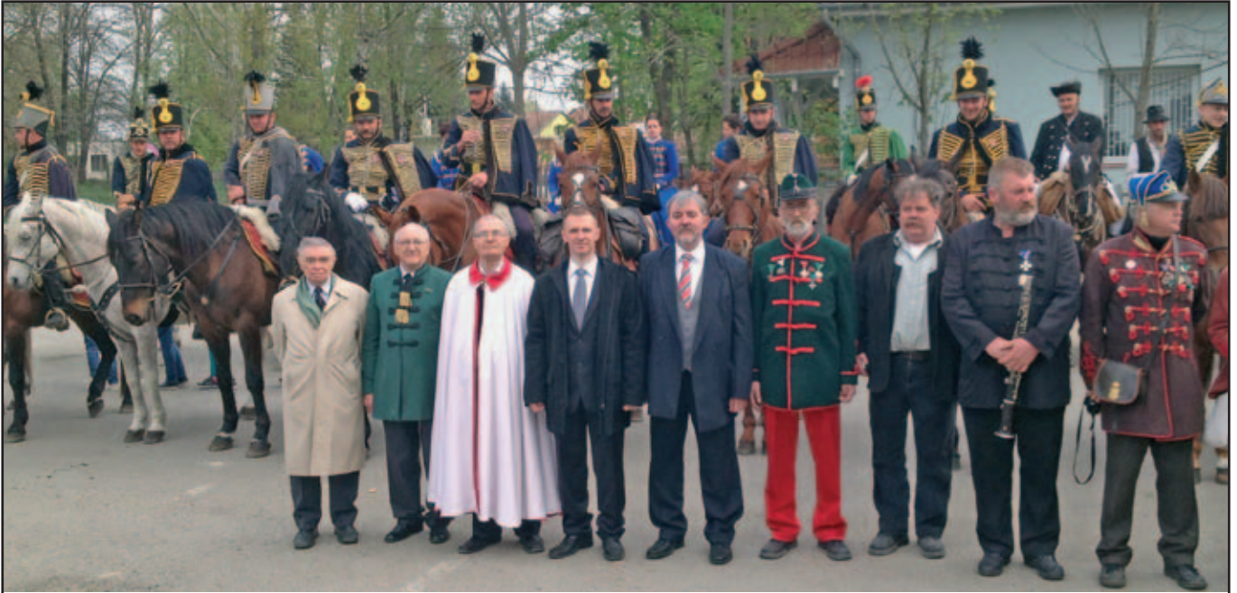
A Tavaszi hadjárat résztvevői