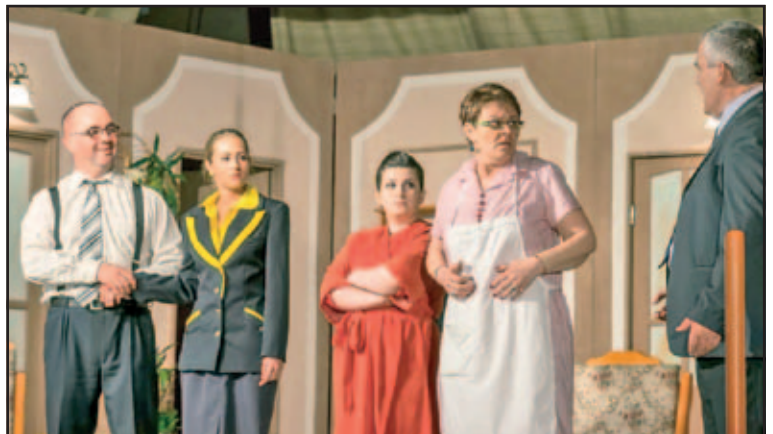
Részlet a Leszállás Párizsban című előadásból