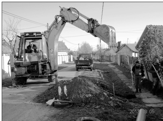
Elkezdődött a csatornaépítés Szentmártonkátán