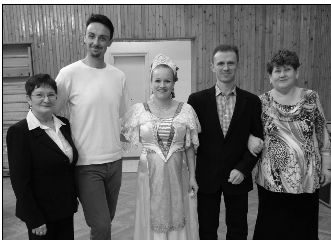
Az operettgála szervezői és szereplői