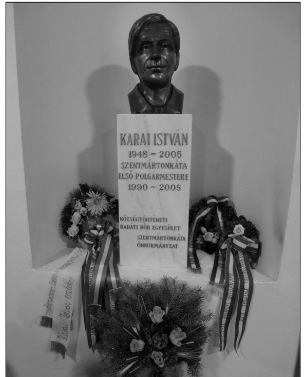
Karai István polgármesterre emlékeztünk