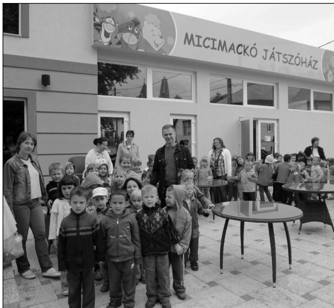
A benti óvodásokkal a Micimackó Játsszóházban

már egy kicsit elfáradva, elpilledve utaztak a gyerekek. Remélem, mindannyian jól érezték magukat. Sikerült megbe-