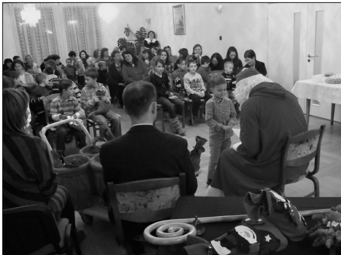
A polgármesteri hivatalban is járt a Mikulás

találkozni a Mikulással. Először a polgármesteri hivatalba látogatott el, megajándékozva az önkormányzati dolgozók gyermekeit. A benti óvodába is hatalmas puttonnyal érkezett – amit a mellékelt fotó is tanúsít. Még a nagyobb gyerekek is kicsit megilletődve, csillogó szemmel vették át a csomagokat.