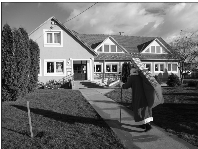
Hatalmas puttonnyal érkezik a Mikulás a benti óvodába

Az utóbbi időben több jelzés is érkezett felém a kerékpáros közlekedéssel kapcsolatban. Szeretném felhívni a településen kerékpárral közlekedők figyelmét a balesetveszélyekre. A kerékpáron a megfelelő felszerelés, pl. lámpa, csengő hiánya egyébként is, de különösen a téli, ködös időszakban komoly veszélyeket rejt magában. Több alkalommal balesetet előzhetett volna meg községünkben is meglétük. Különösen veszélyesek a szinte hangtalanul suhanó elektromos kerékpárok. Kérem, figyeljenek egymásra, csak a kerékpárosok részére kijelölt utat szíveskedjenek használni.