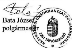
Bata József polgármester

Amennyiben a képzés felkeltette az érdeklődését, jelentkezni lehet Tápiószecső –Nagyközség Önkormányzat Polgármesteri Hivatalánál személyesen vagy a 06-29-448-122 telefonszámon.