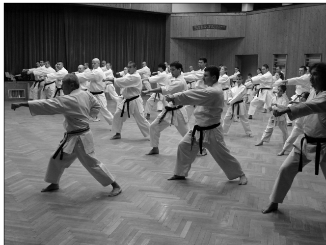
Kemény edzést tartott a 9. danos nagymester

dik legmagasabb státusszal rendelkezik a világon. Amint láttam, az edzés igen kemény és fárasztó volt, alaposan megmozgatta a karatékákat. A helyi szervezet eredményeit mi sem bizonyítja jobban, hogy tagjai közül idén többen is sikeres danvizsgát tettek, a versenyeken jól szerepelnek, illetve az, hogy már hat fekete öves mester edz és tanít Szentmártonkátán. A küzdősportolóknak gratulálok és hasonló szép sikereket kívánok.