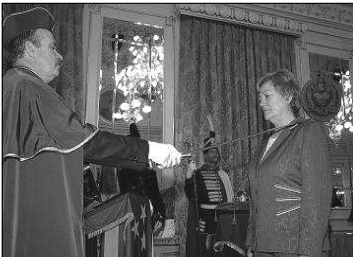
2011. január 22-én a Magyar Kultúra Lovagi cím adományozása

Tanúi lehettünk a XV. Magyar Kultúra Napja Gála rendezvényének, mely az