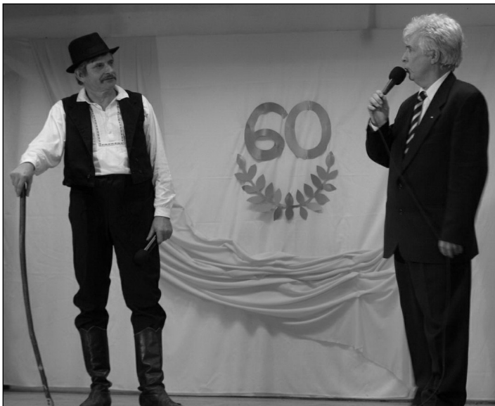
Az „Ofella Sándor” Hagyományörző Népi Együttes jubileumi műsorából