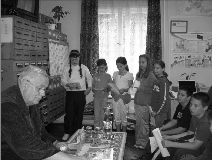
Rigó Béla hallgatja a gyerekek versmondását

Az újtelepi 4/b osztályt – különjáraton – a Weekend-busz szállította ide és vissza. Ezúton is köszönjük a segítséget és az anyagi ellenszolgáltatás nélküli támogatást. A találkozóra néhány gyerek is készült az író verseiből. Azután az író bácsi mutatta be a könyveit, fejből idézve verseit, történeteit. Sok kér-