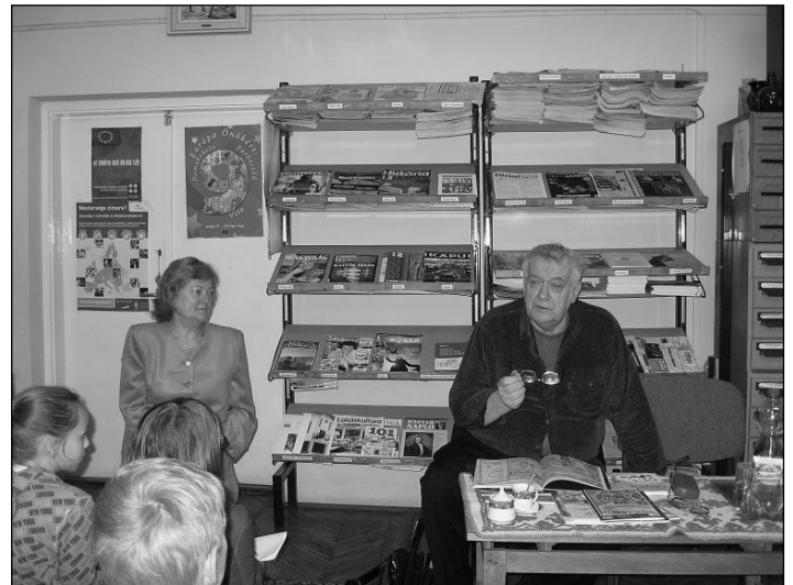
Rigó Béla író a vendégünk