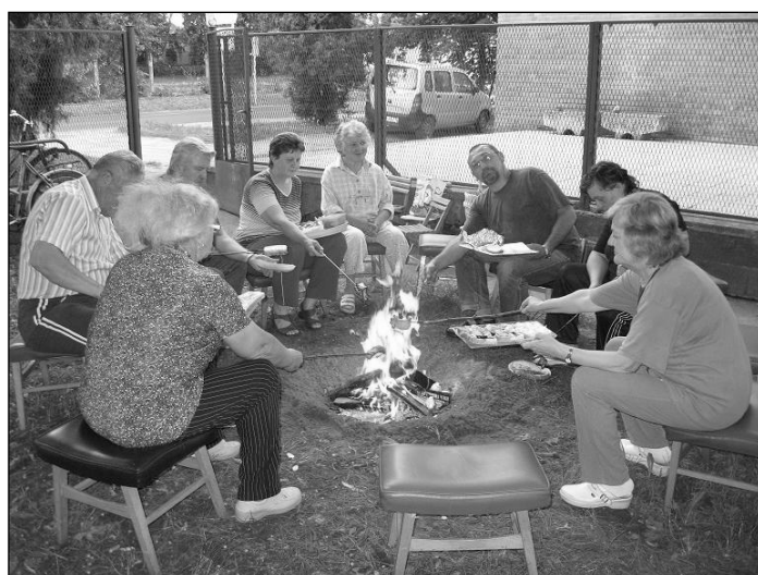
A Magvető Klub tagjai szalonmát sütnek a könyvtár udvarán (2010. június 28.)