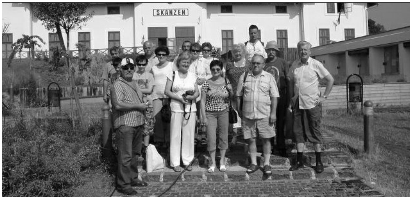
A Magvető Klub tagjai a szentendrei Skanzen bejárata előtt