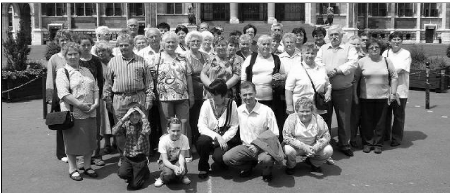
Az Országház előtt