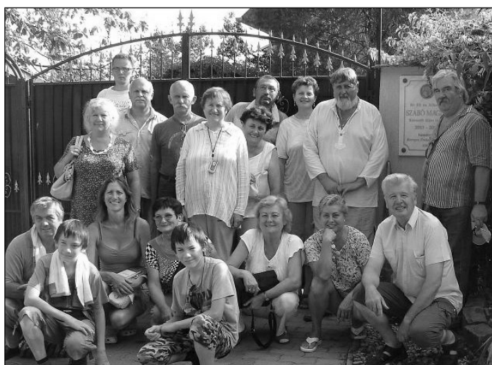
A Magvető Klub tagjai Szabó Magda író emléktáblája előtt