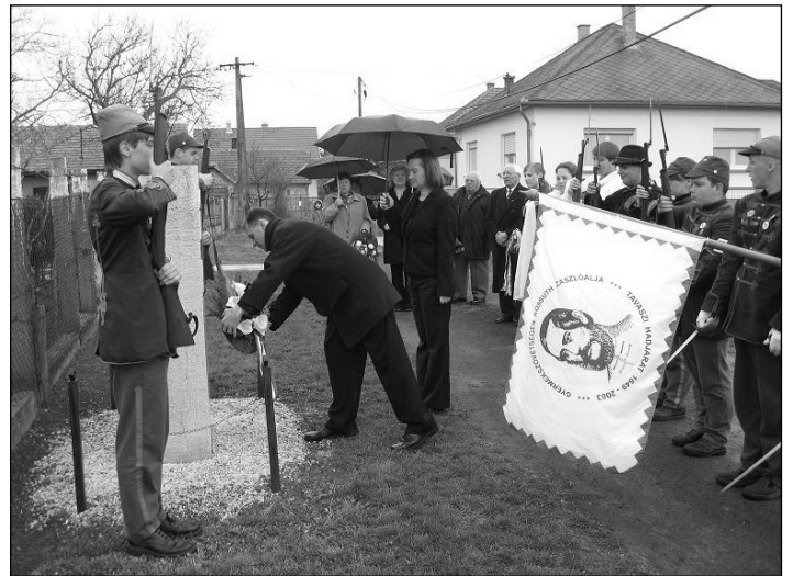
Koszorúzás a Kossuth-émlékműnél

• Szeretném tájékoztatni a Tisztelt Lakosságot a Pannon-torony, pontosabban Pannon-bázisállomás létesítésével kapcsolatban. Évek óta húzódó vitákat, aláírásgyűjtéseket követően, tavaly a testület pozitív döntést hozott az átjátszótorony megépítésére vonatkozóan, s engem bízott meg a szükséges intézkedések lebonyolításával. Felvettem a kapcsolatot a Pannon hálózatbővítésért felelős szakemberével, aki elmondta, hogy az őket is érintő válság miatt racionalizálták a toronyok építését, azaz csak kiemelt jelentőségű helyen élnek ilyen jellegű, nagy költséget igénylő fejlesztéssel, ahol például egy-egy városrészt tudnak lefedni, vagy takarékos megoldás gyanánt mesterséges építményeket használnak fel berendezéseik telepítésére (templomtorony, víztorony stb.). Mivel nálunk egyik lehetőség sem áll fenn, egyelőre nincs a következő negyedéves fejlesztési tervükben Szentmártonkátán bázisállomás létesítése. Ennél távolabbi időtávlatra pedig nem tudnak információt adni. Az illetékes szakember elmondta, hogy nincs elvetve a létesítés, de negyedéves terveket készítenek, és a mi településünk nem szerepel a következőben. Ennek ellenére folyamatosan figyelemmel kísérem az ügy alakulását, és minden tőlem telhetőt megteszek, hogy mielőbb megvalósulhasson a beruházás.