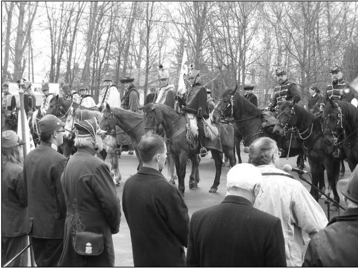
A TAVASZI HADJÁRAT-ünnepély – Huszárok