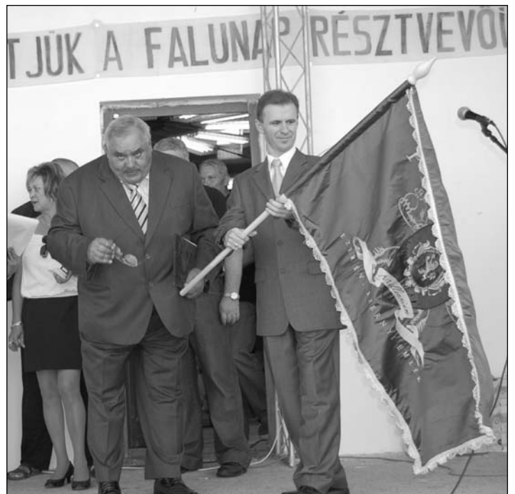
A milleneumi zászló átadása

Délután községünk óvodásai és általános iskolásai kis műsoraikkal tették változatossá a programot és szórakoztatták a jelenlévő közönséget. Öröm volt látni a lelkesedést és az őszinte mosolyt arcukon. Köszönöm a felkészítő iskola- és óvodapedagógusoknak, valamint a szülőknek és természetesen a gyerekeknek is szorgos munkájukat.