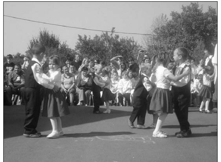
A Csillag csoport falunapi tánca