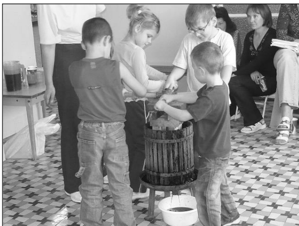
Szüret a Virág csoportban