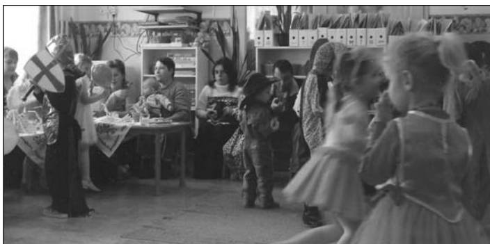
Farsang az óvodában

December havát magunk mögött hagyva jólesik a januári nyugalom. Miután kellőképpen megterhelte szervezetünket az ünnepi bejgli és a szilveszteri malacsült, jöhet a pihenőidő-