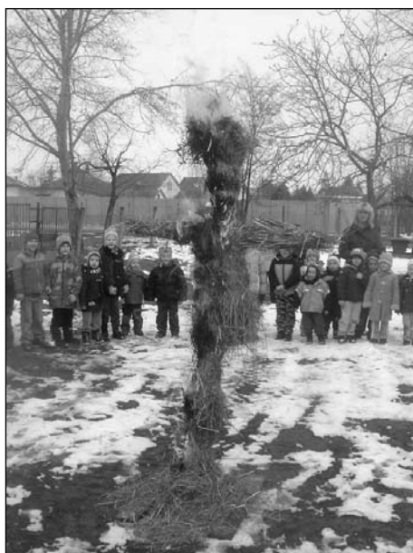
Kiszebáb égetése az Úttörők utcai óvodában

tonként egy-egy rövid műsorral. A mókás műsor után a gyerekek izgatottan öltötték magukra jelmezeiket, és sugárzó