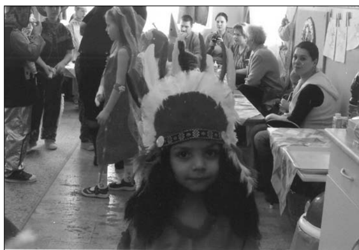
Farsang az óvodában

arccal várták a hatást: társaik és a felnőttek pozitív véleményét. A jelmezek idén is sokrétűek voltak, volt készen vásárolt vagy kölcsönzött, és volt a szülők fantáziáját dicsérő, házilag készített maskara is. Megelevenedtek film- és mesehősök, pl.: Batman, Pókember, Mici mackó és Tom (a Tom és Jerryből), és színre léptek egyéb ötletes szereplők is: volt indián, hercegnő, tündér, rendőr, orvos, focista, nindzsa, pillangó, méhecske, rosszesont... és még sokan mások. A kolléganők közül ketten bújtak maskarába, egyikük, mint Galiba, a liba, másikuk pedig japán gésaként lépett a színre. A mulatságot zene, tánc és persze sütemény és üdítő tette igazán vidám télbúcsúztató ünnepé. Reméljük, hogy multságunkkal valóban elkergettük a telet, s az igazi tavasz már nem sokáig várat magára.